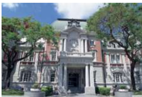
臺灣文學館是研究臺灣文學的寶庫。