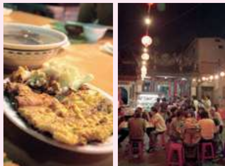
廟埕前的松仔腳可讓您體會最道地的庶民美食。