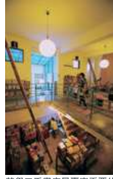
草祭二手書店是臺南重要的人文據點。

以孔廟為中心，周邊府前路及南門路也與府中街串連發展出區域特色，無論是最有氣質的二手書店草祭，或者是經營超過六十年始終門庭若市的莉莉水果店，都受到觀光客熱烈喜愛，這一帶值得慢慢欣賞品味，若來到臺南可千萬不能錯過品嚐濃濃「府城味」的機會。