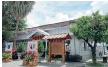
來到保安車站除觀賞建築樣式之外，別忘了買「永保安康」的紀念品回去。