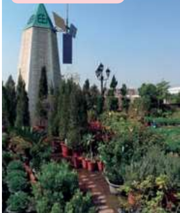
全年無休的七甲花卉園區，是臺南近郊購買花卉的好去處。