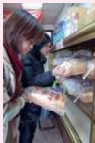
嘉芳吐司賣完為止，想買得趁早。

可放三天（無須放置冷藏保存），若是剛出爐的吐司，請先將袋口打開以散發熱氣，若要存放較長時間，當日請以報紙包裹放至冷凍庫，勿超過五天。