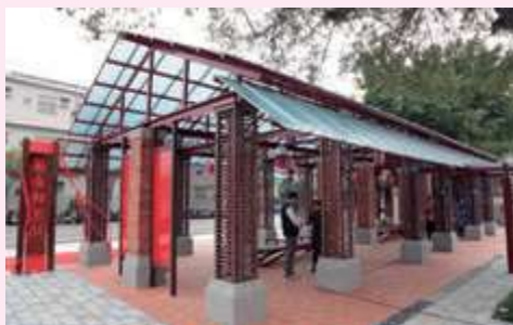
保安轉運站將遺跡與轉運功能巧妙融合，也打響大臺南轉運中心的第一炮。