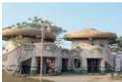
臺南都會公園佔地寬廣，景觀滯洪池具休閒及保水功能，也讓水岸成為都會公園美麗的景致。