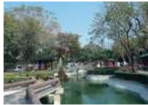
延平郡王祠庭園開闊，花季時可賞繽紛美景。

延平郡王祠中珍貴文物豐富，尤其有為數眾多的清代楹聯，包括原廟創建者沈葆楨手書，筆力雄渾、意義雋永，極具歷史價值。祠旁文物館收藏許多臺南文物，亦作為展覽使用，在開山路與大埔街口還可看到泉州市送給臺南市民的鄭成功騎馬石雕像。