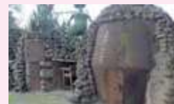
青龍山土雞城燒製美味的土窯。

位在臺南關廟的青龍山土雞城，成立至今已有三十多年，佔地寬廣，以庭園造景、遊樂設施、青龍噴水造景景觀、船造型包廂、迷你吊橋、觀景樓等，規劃出有如公園般的空間，還有山羊、放山雞、鱸魚可欣賞，相當適合全家人前來用餐，享受大自然的悠閒氛圍。招牌土雞料理有苦瓜鳳梨雞、枸尾雞、鹽焗雞、鳳梨蜜汁雞、土窯雞等，都是顧客必點的招牌菜，還有提供宅配服務喔！