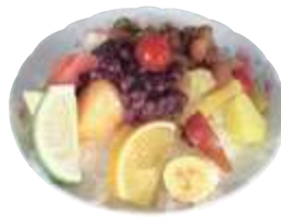
交通資訊：林百貨站下車 步行約5分鐘