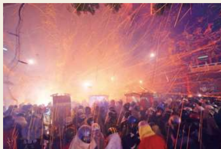
蜂炮齊發，火力全開。