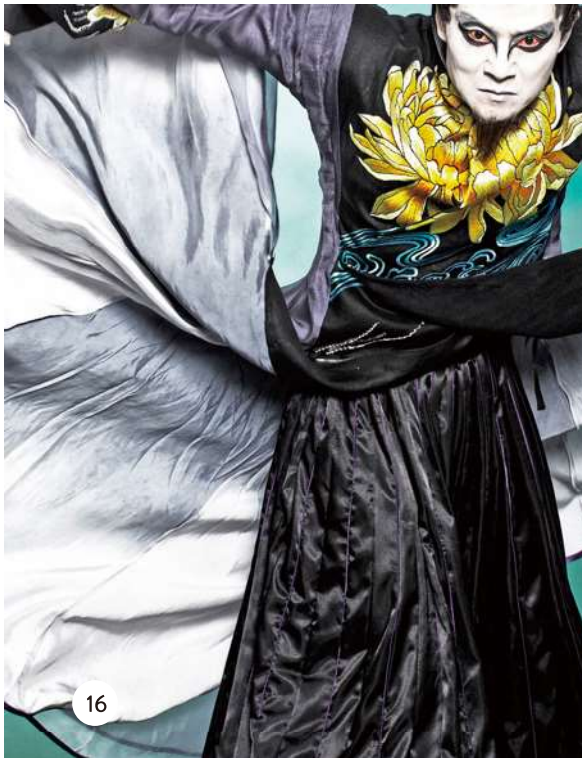
當代傳奇劇場《水滸108II—忠義堂》。