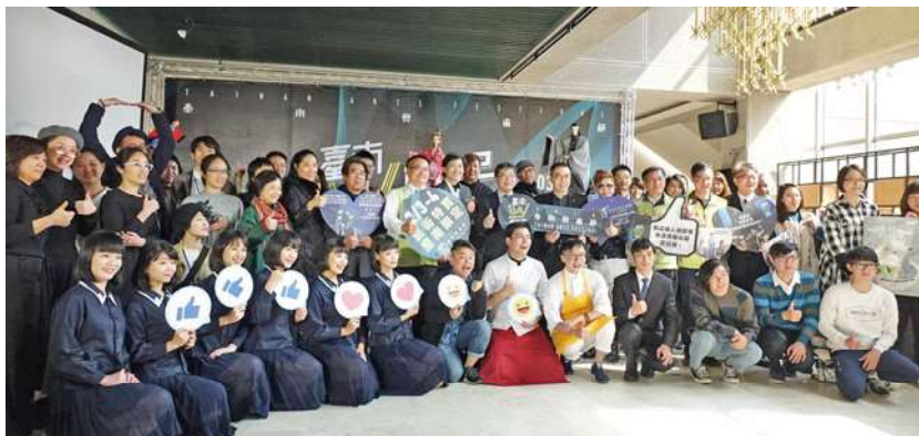
臺南市政府邀請國內外及在地表演工作者一同參與這場盛大的藝術盛宴。