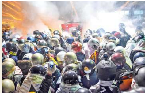
1 | 2 圖1：許多民眾全副武裝，參加這場蜂炮盛典。 3 圖2：神轎遶境所到之處皆蜂炮四射。