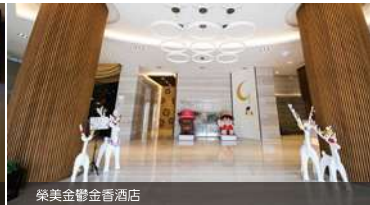
榮美金鬱金香酒店