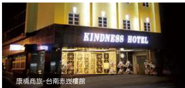
康橋商旅-台南赤崁樓館