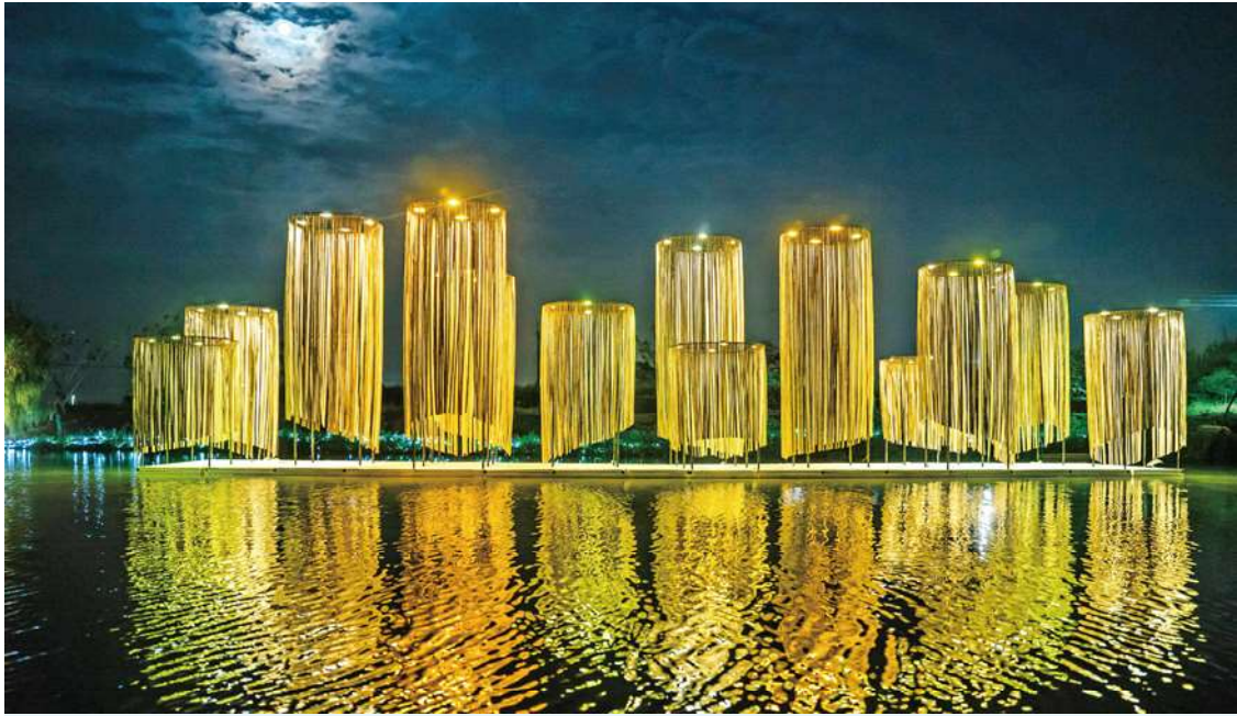
無關——禹禹藝術工作室。