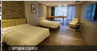
三道門建築文創旅店