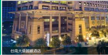
台南大億麗緻酒店