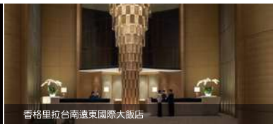
香格里拉台南遠東國際大飯店