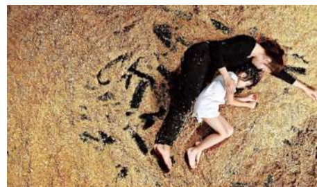
上：《日光，酸甜》經典舞作。