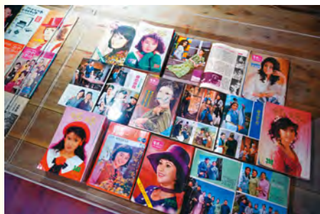
主題館蒐羅許多當年眷屬留下的書報刊物。