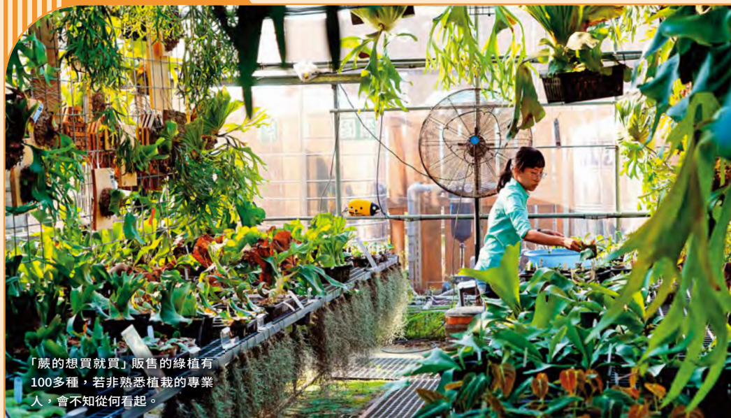
「蕨的想買就買」販售的綠植有100多種，若非熟悉植栽的專業人，會不知從何看起。

鹿角蕨是這幾年相當流行的植栽，主要產地多在熱帶、亞熱帶地區，氣候環境和臺灣相近，因此臺灣這幾年也出現許多賣家與愛好者。「蕨的想買就買」就是一間鹿角蕨專賣店，150坪的大片園地，是蕨類愛好者的樂園，來到這裡總是流連忘返，沉浸在這園地，即使是植栽園藝入門者進到裡頭，面對滿室綠意，數不盡的品項，也感到目眩神迷。