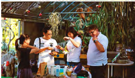
蕨類世界奇妙，可以大得如人一般高壯，也可以嬌小得掌中盈握。

人，進到園區會不知從何看起，這時就可以主動詢問老闆或園區人員，他們在你開口前，可是秉持著店名精神，不打擾、不強迫推銷，就是讓你自個兒好好看，「覺得想買就買」。