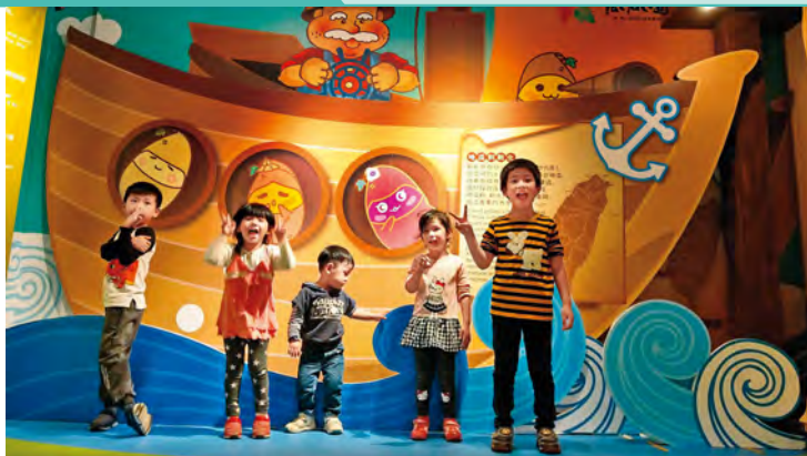
帶小朋友到「瓜瓜園地瓜生態故事館」探索地瓜世界，可以DIY料理，還能下田體驗挖地瓜的樂趣。