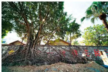
宿舍外面，老樹攀附的石牆上，還留有當年的政治標語。

全新水交社文化園區，規劃了8大主題館，包含水交社歷史館、文學沙龍館、飛行親子館、藝術特展館、眷村主題館、眷村食堂等，館內有許多水交社的過往歷史介紹，看看這些年，這些老房子經歷了哪些事；也有模擬市井攤販，可以親子互動的水交社菜市場；還有櫥窗展示舊文物，蒐羅當年眷屬留下的書報刊物，看著這些舊時景物，再沿著宿舍外，老樹攀附的石牆漫步，更引人生出思古之幽情。