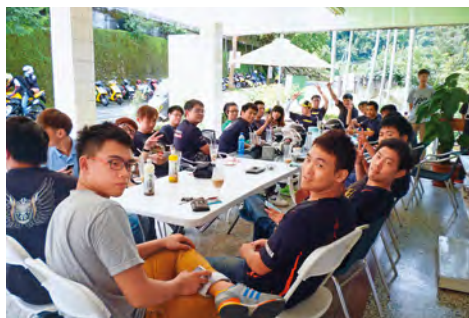
假日的妙咖啡是重機車友聚集地，不少騎士聞香而來。