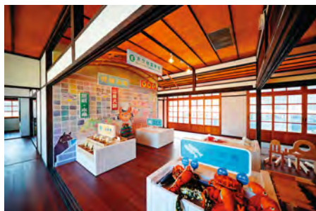
模擬市井攤販，適合親子互動遊玩。

水交社眷村美食家喻戶曉，包括山東大餅、獅子頭、臘腸等，都是人氣滿滿的特色招牌，而且每家口味各有巧妙，可以逐攤比較挑選，一次買齊所需年貨。選購美食外，現場也有春聯揮毫、彩繪塗鴉活動，志工還會帶著民眾DIY，手作懷舊糕點，讓大人、小孩一同體驗，享受古早味氣氛。