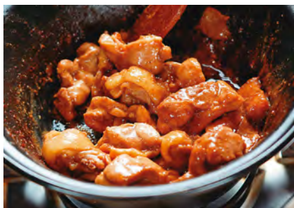
穀倉餐廳的招牌火鍋一鍋兩吃，加湯熬煮前，可以先吃幾塊乾炒嫩雞肉。

還沒走進餐廳，麻油煸薑的香氣已經四溢，穀倉餐廳招牌餐食「麻油雞鍋」，是店內用餐顧客必點項目，選用西港農會生產的黑麻油，加上薑片、少許米酒翻炒雞腿肉，而且這翻炒動作還是客人自己來。