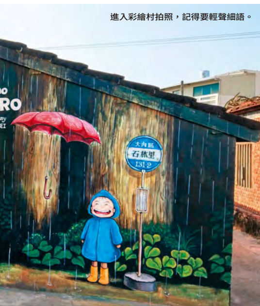
進入彩繪村拍照，記得要輕聲細語。

不過，也要提醒遊客，拍照時記得輕聲細語，不要影響到住戶的安寧，除了美麗的照片和回憶，垃圾記得帶走喔！