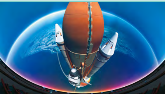
星象館3樓設置了國內第一個採用數位球幕的3D星象劇場。

並開放的建築，現則著手改造成為國內首座望遠鏡博物館。這裡收藏及設置各個年代、不同口徑的天文望遠鏡，可了解望遠鏡發明史，還有全新打造的「伽利略書房」，民眾可以置身在書房中，遙想第一位使用望遠鏡做天文觀測記錄的科學家伽利略，當時觀測的情景。