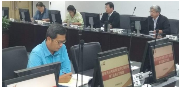
會議主席張政源副市長致詞

臺南市政府於 107 年 6 月 15 日召開第 1 屆族群主流化推動會第 2 次委員會議，該次會議邀請到總統府諮議同時也是臺南市政府族群主流化推動會委員阮俊達先生，針對族群主流化議題進