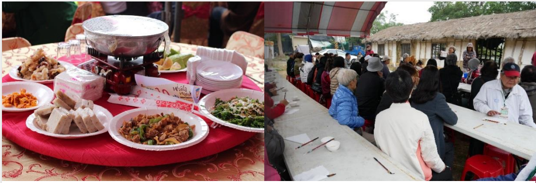
平埔族風味桌菜（圖左）：DIY 植物染教學（圖右）

第六屆首次整合臺南市各西拉雅聚落特色美食為風味桌菜，並結合微旅行、西拉雅植物染diy、西拉雅十字繡、部落農器具展示及頭社小農市集等推出5條西拉雅人文體驗遊程，有近300名民眾報名參與。