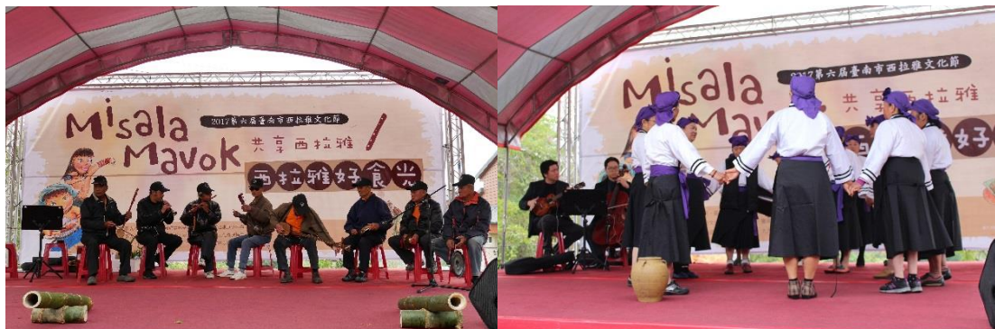
西拉雅好食光開幕表演：八音表演（圖左）；牽手飛歌（圖右）

臺南市政府自102年開始辦理西拉雅文化節，每屆都設定一個西拉雅語代表當年活動主題，第一屆從介紹西拉雅美麗文化風情開始，今年第六屆則邀請大家一起到聚落圍桌、分享食物，透過美食的交流共同分享西拉雅文化。