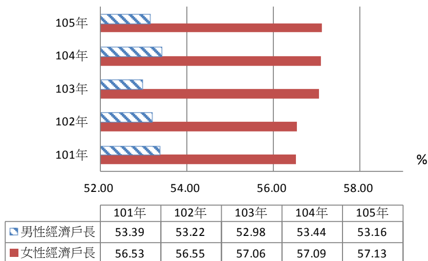
圖2. 全國近5年不同性別經濟戶長家庭在「食品及非酒精飲料」、「住宅服務、水電瓦斯及其他燃料」與「醫療保健」三個方面向消費占消費支出比率

五都近5年男性經濟戶長家庭可支配所得、消費支出均比女性高，女性經濟戶長家庭可支配所得北部三都優於南部二都；近5年女性經濟戶長家庭平均消費傾向除臺中市外，均比男性高，而五都男、女性經濟戶長家庭在平均消費傾向的差異不大。(詳表1)