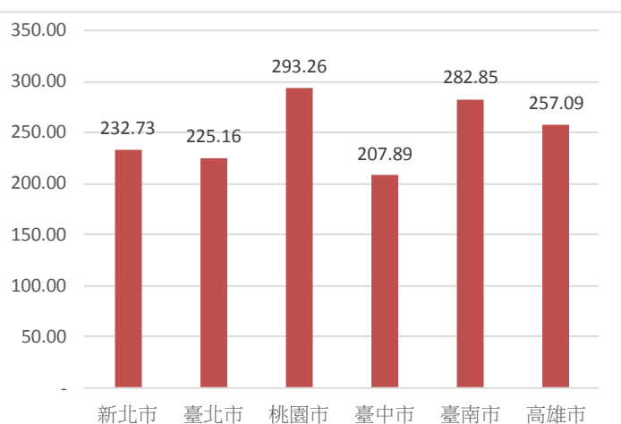
圖2、105年六都竊盜案件犯罪率(件/十萬人口)