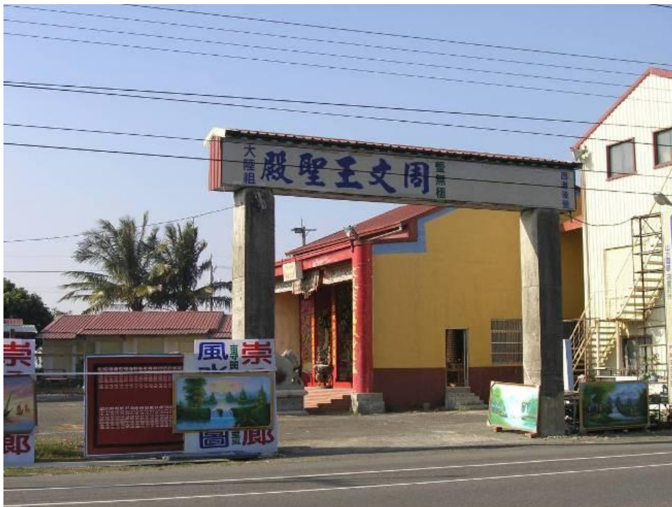
圖：鮮為人知的「那菝宅」舊址所在地

打鐵位於營西里南部，在台糖鐵路以西約 100 公尺處，此處以前曾有打鐵鋪，所以地名稱為打鐵。日治時期的打鐵庄還頗具規模，如今已無人居住，散庄原因不明。