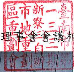
臺南市第 133 期新寮(三)自辦市地重劃區第 15 次理事會會議相片