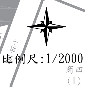
圖例 本次標售土地 地號 (星鑽段) 標號