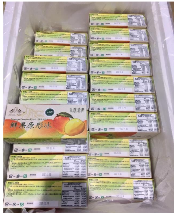
(展示照，右側保麗龍盒裡皆為冠南冷凍芒果條)