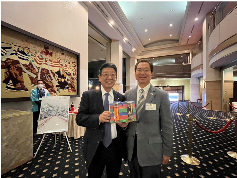
（宮城県南三陸町長—佐藤仁（左）。活動会場照）