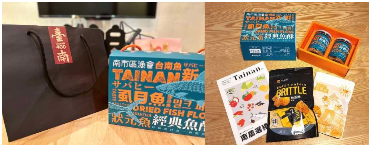
(伴手禮—臺南 400 提袋)