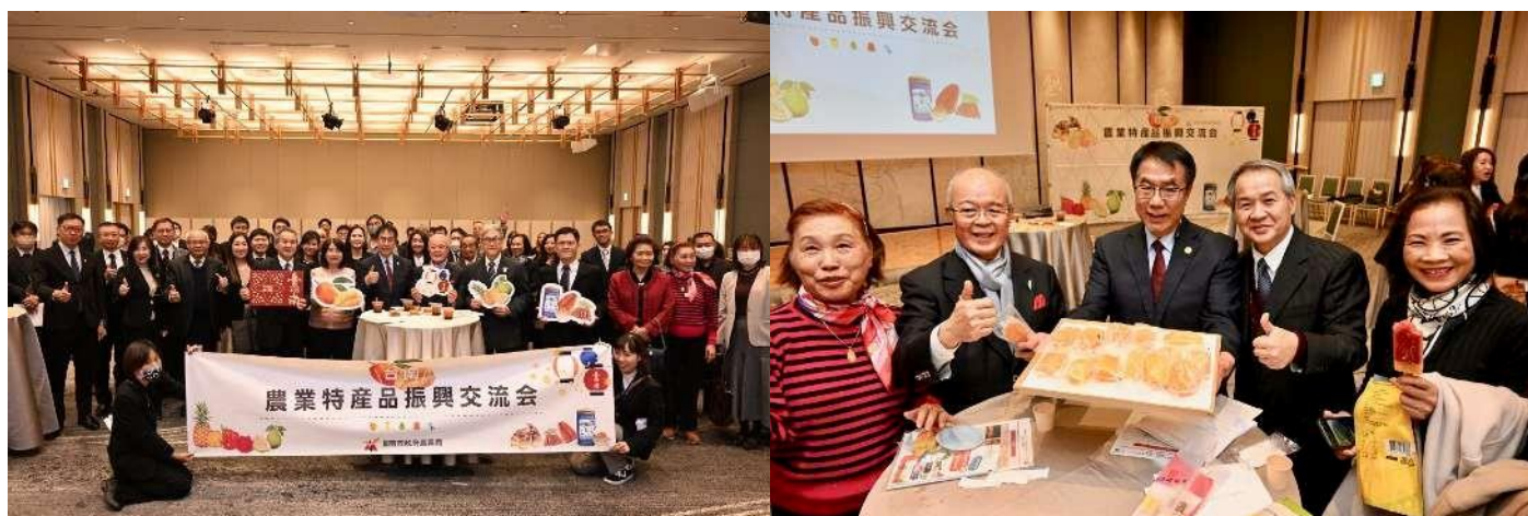
(現場參與貴賓大合照 / 市長邀請貴賓享用鮮果冰棒)