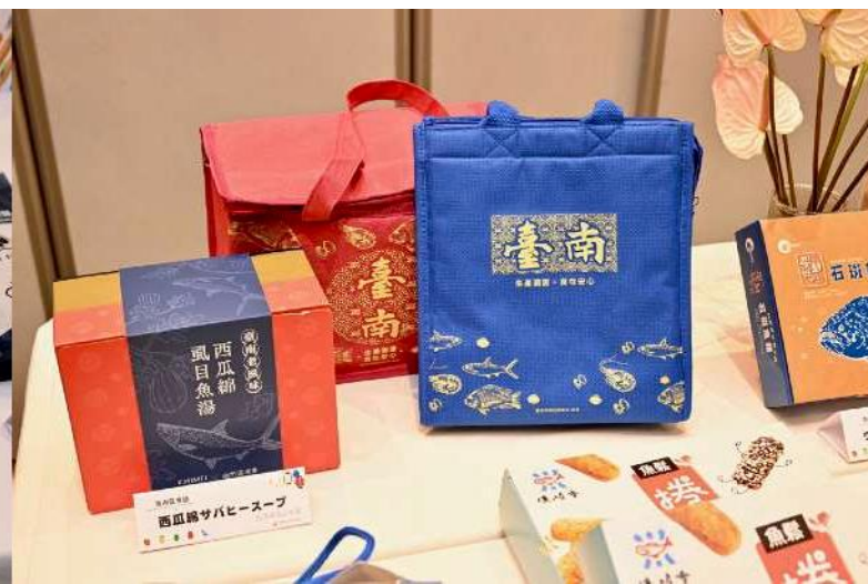
(現場農漁特產展示品區規劃、試吃與介紹)