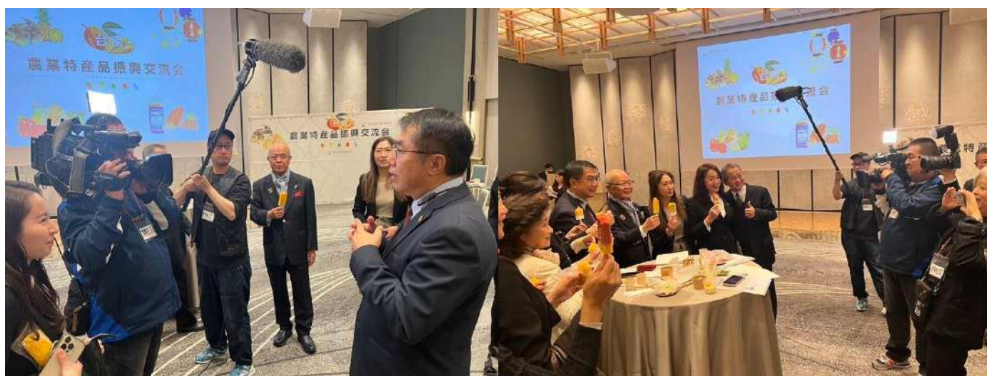
(市長接受現場媒體採訪)