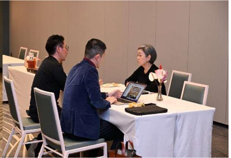
(商談桌位佈置 / 業者商談時間)