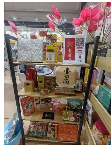
臺南旅遊資訊及伴手禮展桌及展架佈置