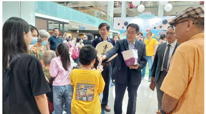
黃偉哲市長於旅展現場發送果乾給參觀民眾