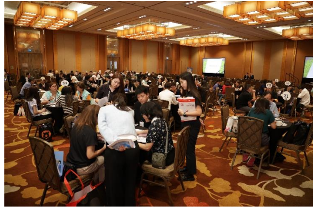
新加坡推廣會實景

本府於 B2B 媒合會後，準備了具備臺南特色伴手禮，臺南 400 果乾及魚頭君娃娃，贈送當地旅遊業者做紀念。深獲參與業者喜愛。