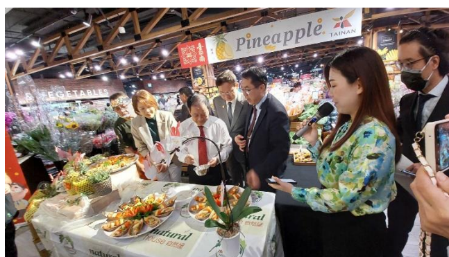
黃大師為鳳梨入菜料理增加臺南風味