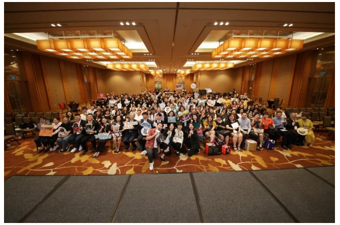
臺灣觀光代表團與新加坡旅遊業者合照