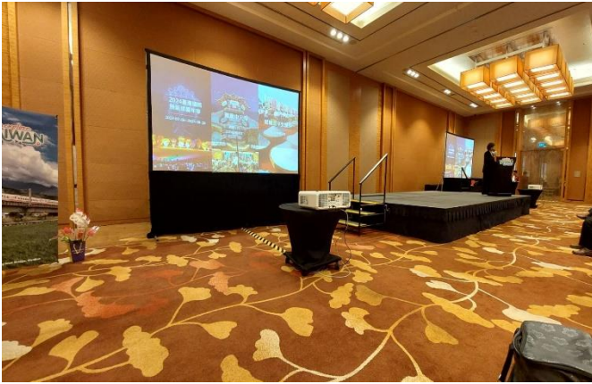
TVA 向業者介紹臺灣特色景點