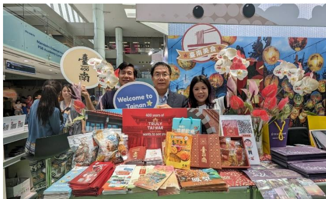
林國華局長(左)、黃偉哲市長(中)，大坑休閒農場代表(右)於臺南展桌合影