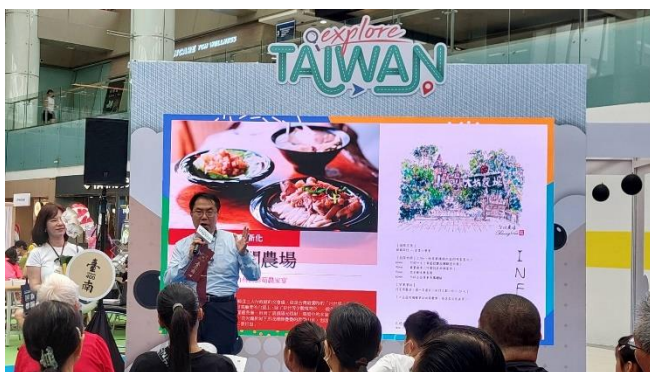
黃偉哲市長向遊客介紹臺南休閒農場