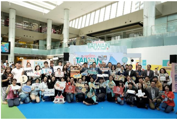
新加坡臺灣旅展臺灣代表團大合照

新加坡地區臺灣旅展 Taiwan Travel Fair 於 2024 年 4 月 19 日至 21 日，在新加坡 Marina Square 購物中心舉辦，代表團於 4 月 17 日下午抵達新加坡樟宜機場並於 18 日前往旅展現場進行展場整備及熟悉環境(本府於 4 月 18 日自行前往)，本次旅展由交通部觀光署委託臺灣觀光協會籌組之臺灣觀光推廣代表團，成員含本市及全臺共 37 個地方政府及觀光旅遊單位，如經濟部產業發展署(工業技術研究院觀光工廠)、臺中市政府觀光旅遊局、臺南市政府、基隆市政府、台灣休閒農業發展協會、及社團法人澎湖縣民宿發展協會等 80 人共同前往。依該購物中心估計，為期三天的旅展活動中，約有 17 萬 2,955 人次進場參觀；臺灣館以極富趣味的珍珠奶茶主題設計吸引民眾目光，成為參展民眾拍照打卡的好地方。