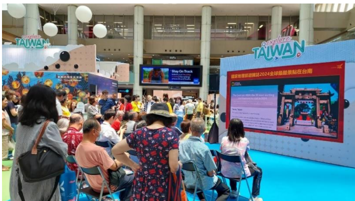
活動現場舞臺介紹臺南旅遊資源