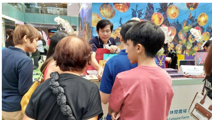
林國華局長向民眾介紹臺南特色

為吸引參展民眾聚集，為期三天展期期間，臺灣館活動不間斷，安排表演團隊及活動主持人於臺灣館舞臺定時帶來精彩演出，如 FOCA 福爾摩沙馬戲團帶來雜耍特技演出，令新加坡民眾驚喜連連；「台灣休閒農業發展協會」烹煮臺灣首款蓬萊米速食麵，淋上與農業部合作推廣的度小月肉燥；觀光工廠提供「拋投擲準遊戲」、「蝴蝶派手工沾醬」、「百香滷包與紙風車」等 DIY 體驗課程。本局以臺南 400、臺南美食伴手禮、臺南旅遊資訊及臺南農產品佈置展桌，還有臺南後壁蘭花及六甲花鶴，引起民眾高度詢問及拍照，另本局於三天展期期間於主舞臺上介紹臺南旅遊資訊並辦理有獎徵答活動，現場民眾踴躍發言，討論熱絡不間斷。