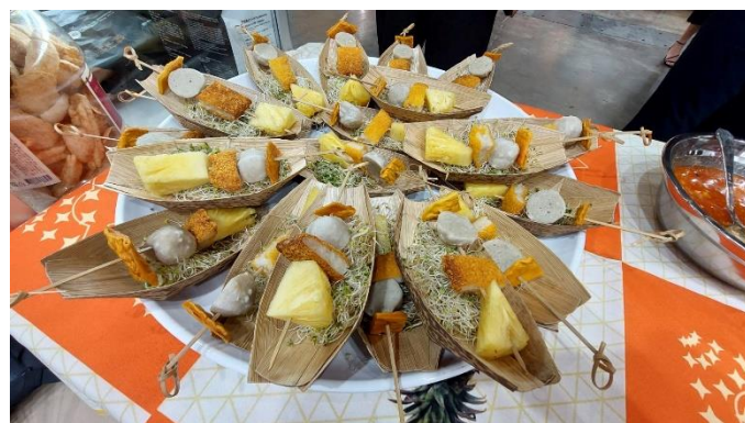
臺南鳳梨與業者試吃食材共同入菜，提供試吃