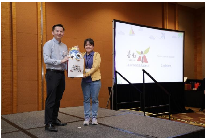
致贈新加坡旅遊業者特色伴手禮

本府於 B2B 媒合會後，準備了具備臺南特色伴手禮，臺南 400 果乾及魚頭君娃娃，贈送當地旅遊業者做紀念。深獲參與業者喜愛。