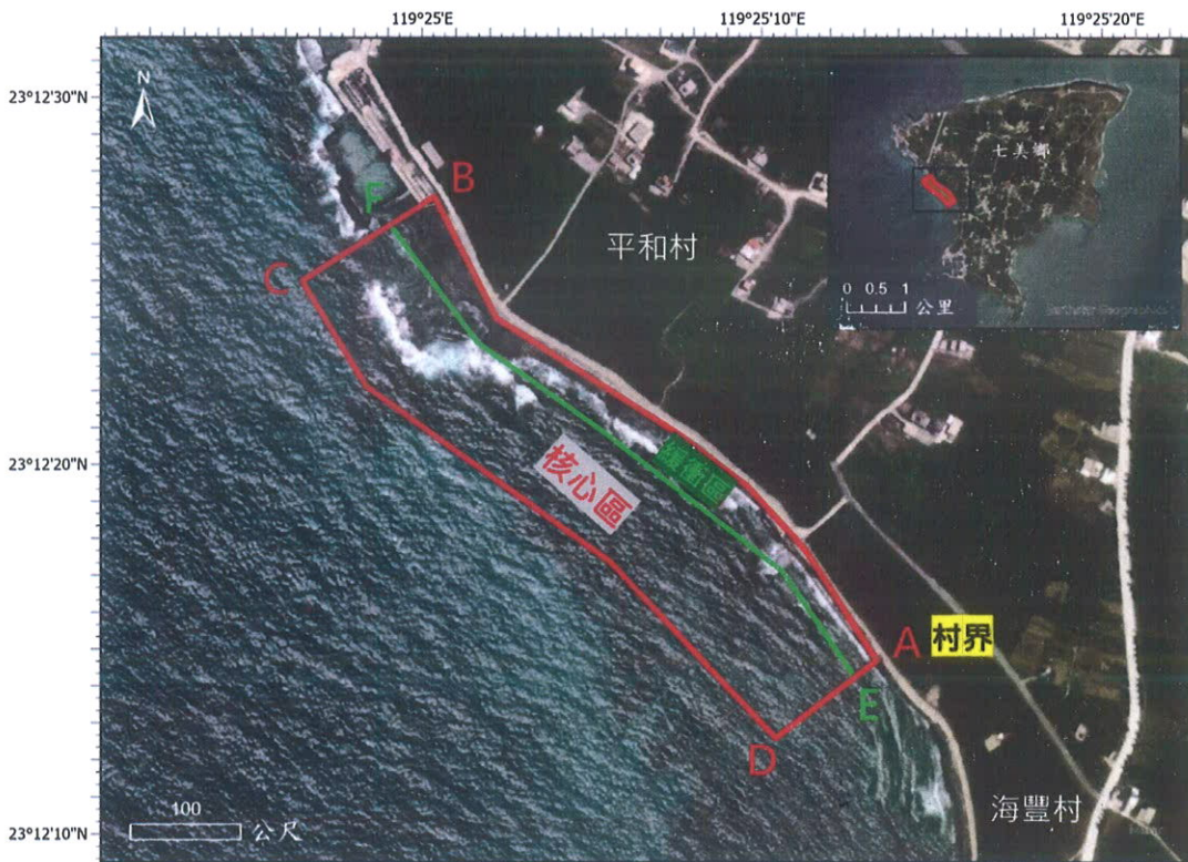
附表二、七美水產動植物繁殖保育區之座標