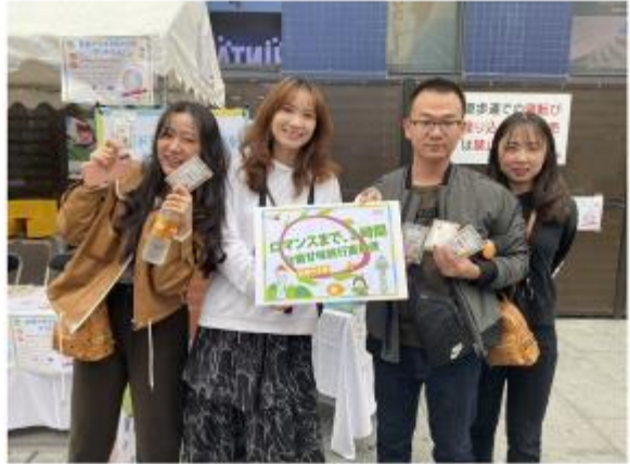
台南市政府前往日本大阪推出戶外廣告，也在當地辦果乾試吃活動，深化台南國際能見度。

【本報記者陳文輝報導】嘉義市山上農會為提升農產品品質，特於今年起，在全縣推行農產品設備更新計畫。目前該計畫已獲得農委會的肯定，成為全國農產品設備更新的典範。