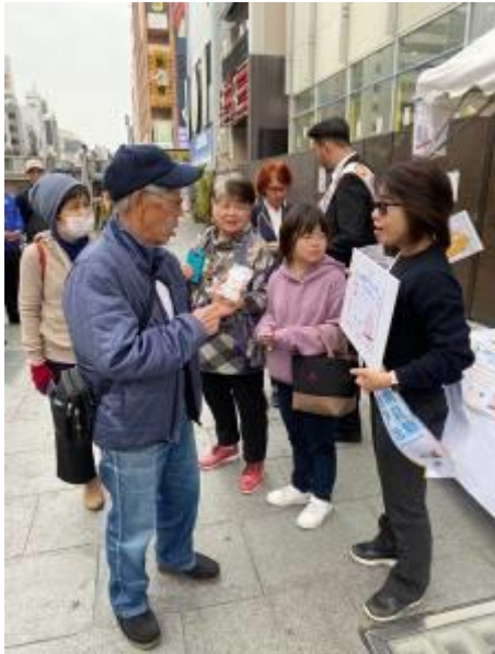
台南城市行銷及芒果乾推廣