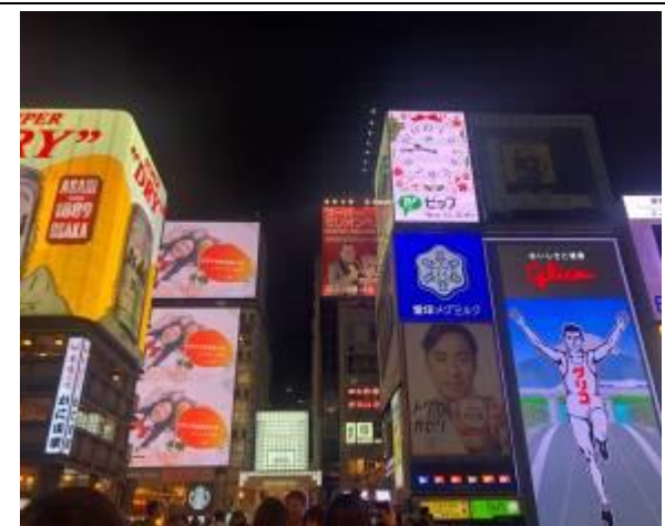
大板道頓堀景點跑跑人旁刊登