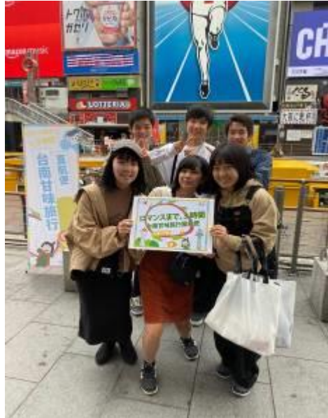
台南城市行銷及芒果乾推廣