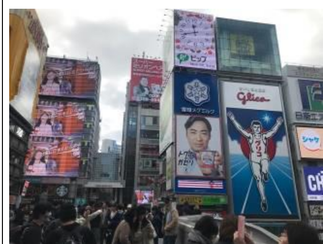
大板道頓堀景點跑跑人旁刊登