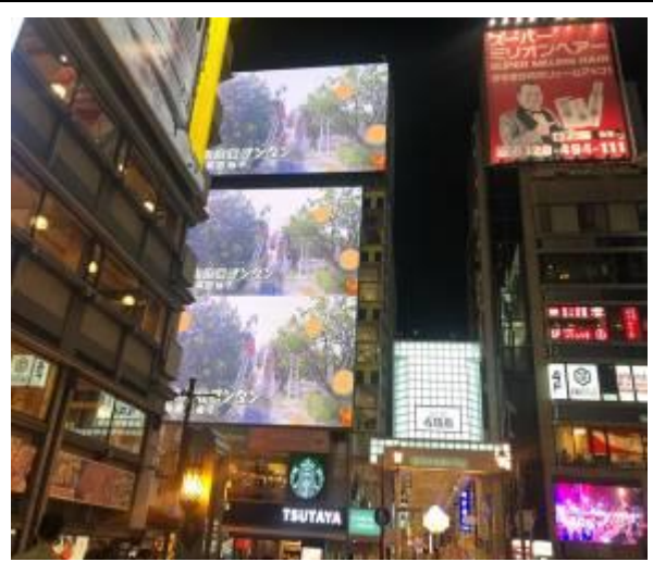
日本大阪-道頓堀 LED 牆廣告刊登(文旦)