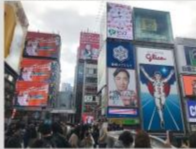
台南市、大阪の道頓堀でプロモーション動画

台南市(台湾南部)は18日より、日本の大阪府のランドマーク、道頓堀グリコサインモニュメントに位置する武揚産物店街の上方3つのデジタル看板と右下にあるスクリーンを使い、台南の観光スポットや農産品を宣伝するプロモーション動画を上映している。動画では、台南市で生産されるフルーツを中心に、市内各地の景勝地を紹介している。