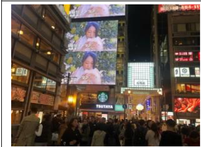
日本大阪-道頓堀 LED 牆廣告刊登