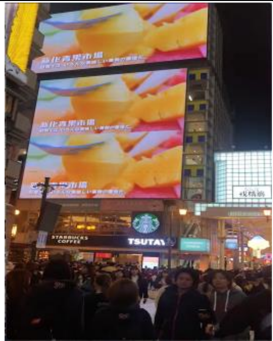
日本大阪-道頓堀 LED 牆廣告刊登