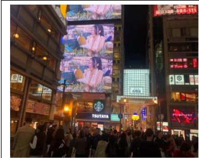
日本大阪-道頓堀 LED 牆廣告刊登(鳳梨)