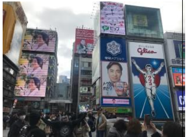
大板道頓堀景點跑跑人旁刊登