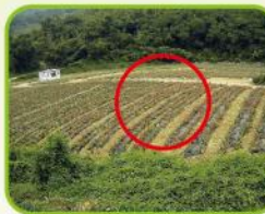
僅能清除地表植生

如有水土保持相關疑義，可於每月第2週之星期四下午2:30至4:30，親洽本府水利局水土保持工程科，由本府水土保持服務團成員免費提供水土保持法令諮詢。詳細時間請來電洽詢。