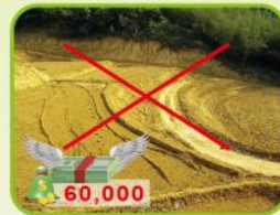
不得整坡改變地形