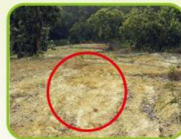
僅能清除地表植生