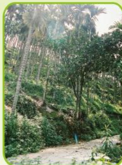
宜林地→種植檳榔 →超限利用