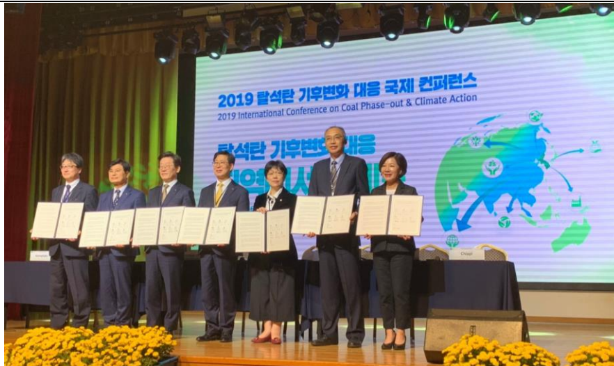
c. 簽署東亞地方政府應對氣候變化之共同宣言之地方政府合影