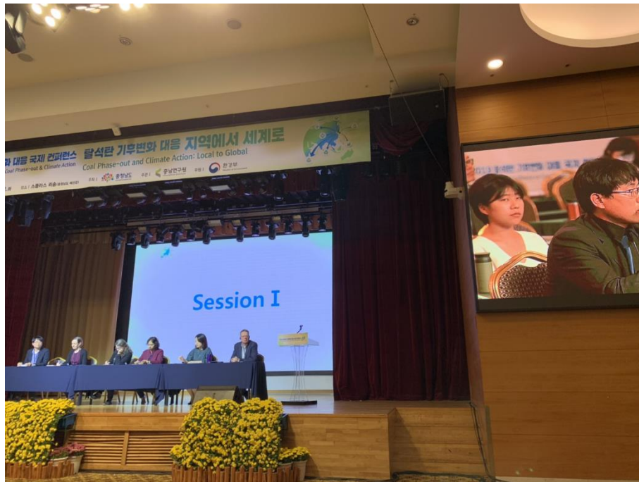
圖 6 專題討論 Session 1 綜合會談剪影