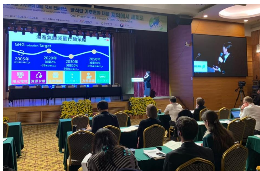
圖 8 王時思副市長分享臺南低碳永續城市成果

臺南市同時積極推動能源轉型及陽光電城計畫，加速推動陽光電城 2.0 計畫，讓原訂 2021 年達到 1GW 的目標，提前於今年 6 月底達標，並設定下階段目標為 2022 年達到 2GW 太陽光電設置容量，以達到百分之百再生能源發電量供全部家戶用電的目標，並響應「棄煤」，推廣低污染能源使用，自 101 年至 107 年間汰換 175 座燃油鍋爐，另透過加嚴生煤許可，本市生煤許可量自 103 年逐年下降，至 107 年已減少 21 萬公噸，減排同時降低污染排放，還給市民好空氣。