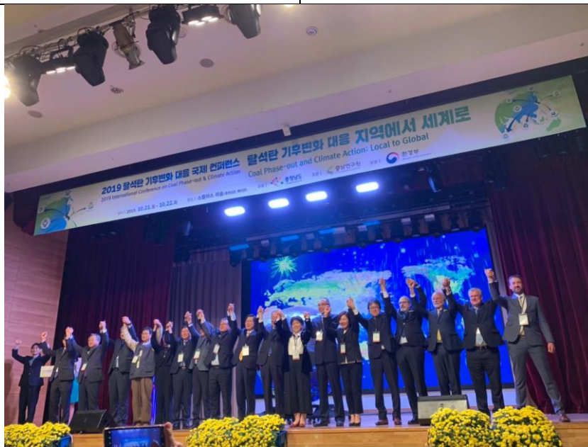
c. 臺南市王時思副市長(中)參加「從社區到世界」表演活動