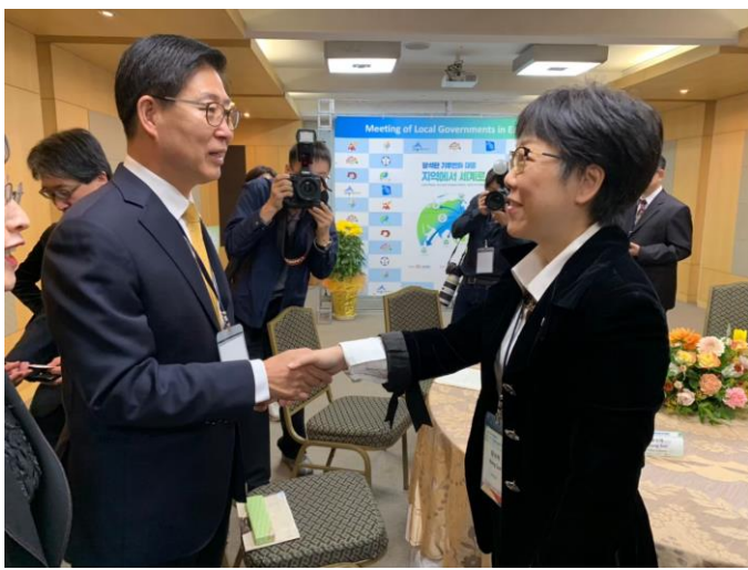
a.王時思副市長(右)與韓國忠清南道廳梁承晁道知事(左)交流問好

市綠色行動目標與願景，並互相表達未來可以更進一步在因應氣候變遷、綠能、產業等領域進行交流與合作的可能性，會後韓國忠清南道廳梁承晁道知事更致贈本市具有城市傳統歷史代表性的「百濟國王及王妃金製冠飾」，本市則以臺南特色農產品—芒果乾與手包茶葉回贈，感謝韓國忠清南道的盛情邀約，並期待未來雙邊城市交流。