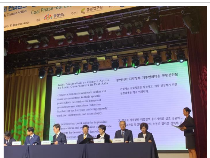
b. 簽署東亞地方政府應對氣候變化之共同宣言