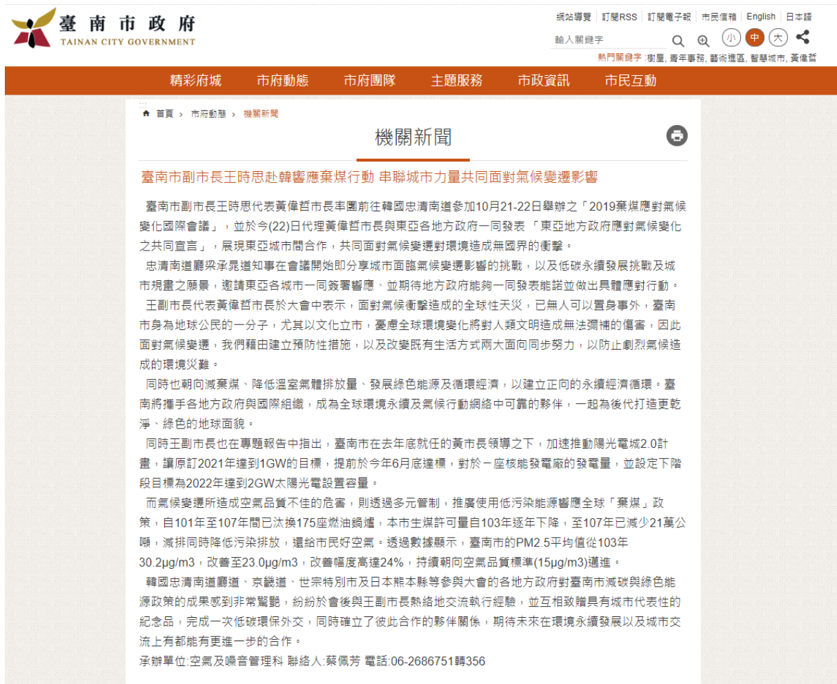
圖 11 臺南市政府 12 月 14 日新聞稿

本次出席韓國忠清南道廳「棄煤應對氣候變遷國際會議」，共發出一篇新聞稿，如圖 22 及圖 23。