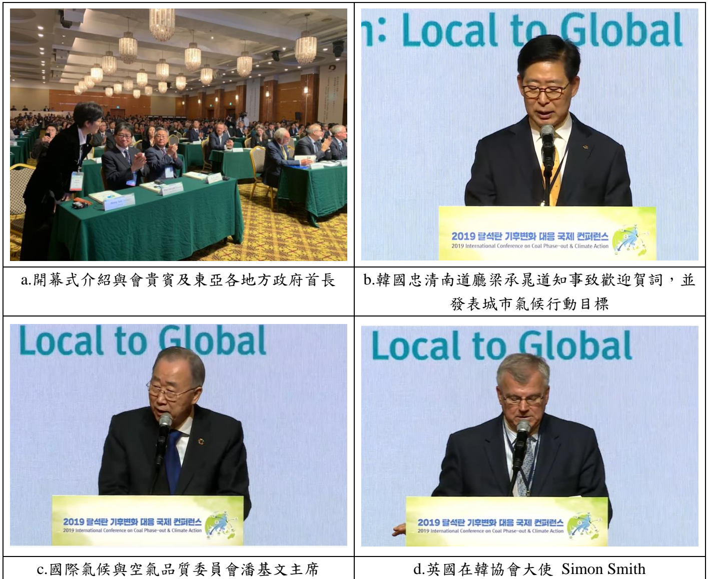
a.開幕式介紹與會貴賓及東亞各地方政府首長