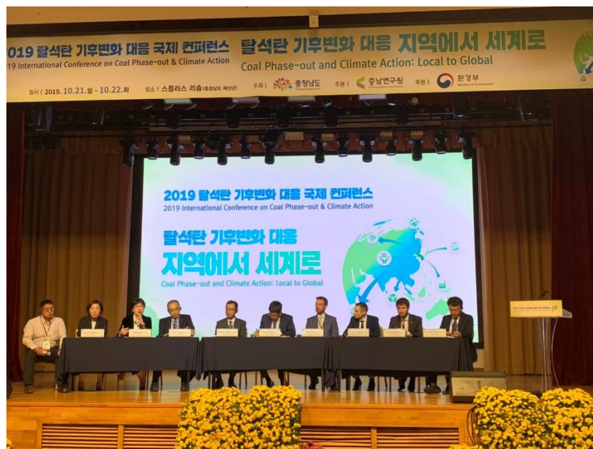
圖 9 專題討論 Session 2 綜合與談剪影

Session 2 的綜合與談時間主持人為韓國氣候解決方案(Solution For Our Climate, SFOC)金柱真常務執行長擔任(下圖中)，表示對於本市能源轉型推動策略感到相當驚艷，並希望能夠進一步了解能源政策推動，中央政府所扮演的角色，以及對於地方政府氣候行動的影響，王時思副市長亦於大會中回應，以臺南城市為例，中央政府與地方政府合作與協力是密切的，在對於產業與能源轉型如果可以獲得中央政府立法的支持，地方政府更能夠有效的實行管制行動，擴大政策推動政策，逐步地達成城市候行動目標。