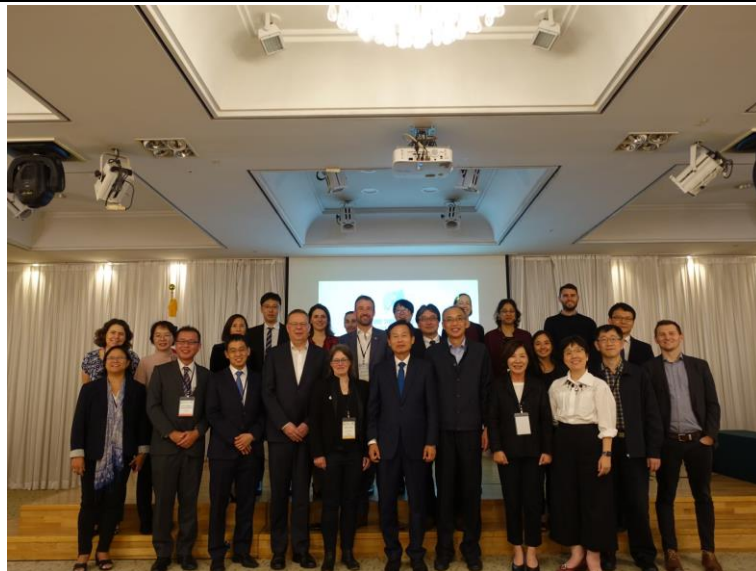
b. 各國與會貴賓及獎者與韓國忠清南道廳文化與體育副道知事合影留念 圖 10 會中與東亞地方政府及國際氣候變遷行動團體交流剪影