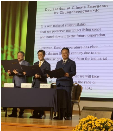
a. 忠清南道廳梁承晁道知事(中)、游謙國議長(右)及住民代表黃承烈(左)發表忠清南道氣候緊急狀況宣示

際關注氣候變遷議題的夥伴，一同上台、點亮地球，讓地球恢復乾淨的環境，本市王時思副市長亦一起上台，作為東亞地方政府的一員，一同響應與支持，經由這個表演活動代表著由地方到國際間合作關係的建立，在因應氣候變遷與空氣品質改善議題上，地方層級，由所有住民與政府單位一同努力；而國際層級，期待可以串連東亞各地方政府與國際氣候行動團體，串聯、落實氣候行動。