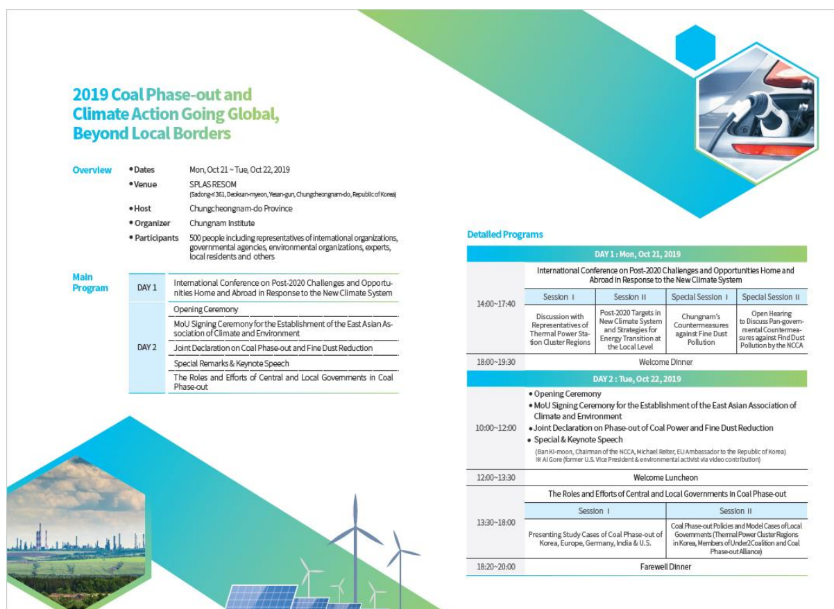
圖 1 2019 棄煤應對氣候變遷國際會議議程表(英文版)

韓國忠清南道廳為制定棄煤應對氣候變遷政策，加強國際間地方政府氣候行動合作，並凝聚環保共識，訂於 108 年 10 月 21 日至 22 日辦理「2019 棄煤應對氣候變遷國際會議 (2019 International Conference on Coal Phase-out and Climate Change Response)」，21 日下午邀請國內外專家進行因應氣候行動與技術研討會議、22 日進行開幕式活動、專題演講、專題討論等系列活動，議程如下圖所示。