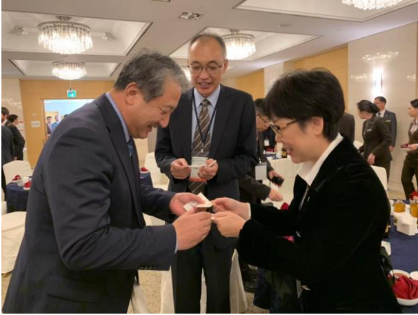
a. 王時思副市長(右)與韓國環境部朴天奎次長(左)互相交流