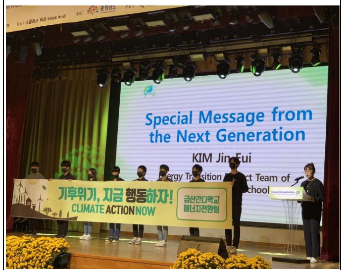
b. 韓國忠清南道當地高中生能源轉型社團發表下個世代的特別宣言