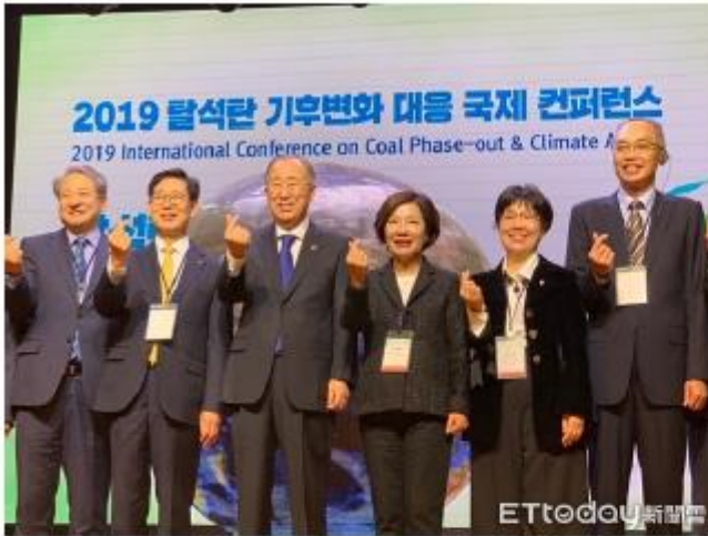
▲台南市副市長王時思（右2），代表黃偉哲市長，赴韓響應棄煤行動串聯城市力量，共同面對氣候變遷影響。