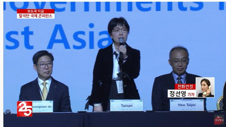
圖 18 韓國電視新聞(KBS NEWS)報導