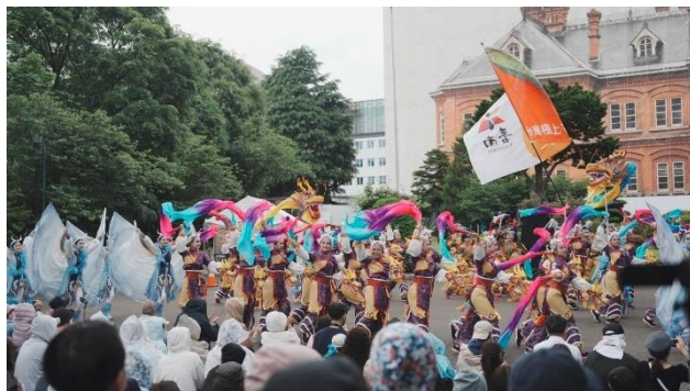
印有臺南旗幟於會場飛揚