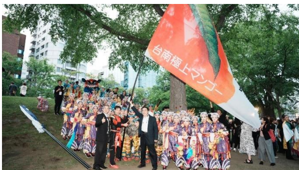
臺灣代表隊定點表演前家市長打氣

油應援，特別安排市長與團隊出場，表演前由市長揮舞特別製作印有愛文芒果及臺南字樣旗幟，將臺南帶到現場觀賞的民眾眼前。表演完畢後，市長前往位於紅磚廳舍臺南觀光行銷區視察，市長親自向現場民眾介紹臺南，邀請往來民眾到訪臺南觀光。在觀旅局積極宣傳下，現場人氣不斷，更有臺南出身的留學生邀請自己參與的索朗祭隊伍成員到場品嚐臺南農特產認識臺南，更一同發放試吃品與文宣品大力推廣臺南魅力! 活動最後，在主辦單位安排下，由黃偉哲市長在本次活動最終決選前上主舞台致詞，向參加民眾介紹臺南，宣布臺南提供 365 顆愛文芒果作為活動獎品，現場觀眾反應熱烈，成功透過本次的活動，讓當地民眾對臺南留下深刻的美好印象。本活動依主辦單位統計破 200 萬人次參與。