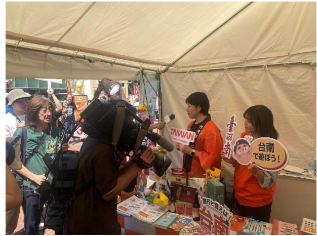
現場媒體拍攝臺南觀光展桌(紅磚廳舍區)

臺南觀光行銷展區外，執行本案主要行程，與觀光署執行 YOSAKOI 索朗祭臺灣代表隊應援及觀光宣傳活動。交通部觀光署自 2007 年起籌組學校團體赴日參加此推廣活動，宣傳臺灣形象，提升臺灣知名度。2024 年本市與觀光署共同辦理「台灣燈會」，亦邀請 YOSAKOI 索朗祭表演團隊來臺南演出。本次本市臺南應用科技大學舞蹈系再參演，觀旅局把握機會，規劃替臺灣代表隊加油打氣同時透過活動參與行銷臺南觀光。