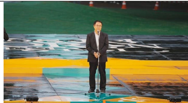
黃偉哲市長主舞台致詞