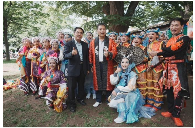
黃偉哲市長與臺灣代表隊合照