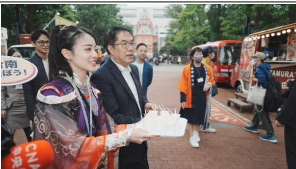
市長親自行銷臺南觀光與農特產