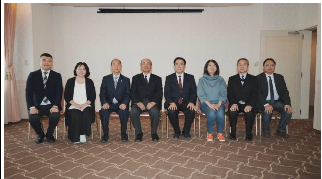
與 YOSAKOI 索朗祭組委會合照