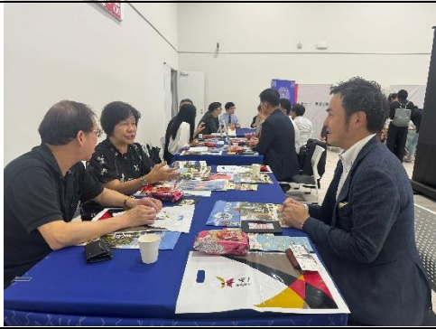
在地業者輪桌與臺南市業者交流 1