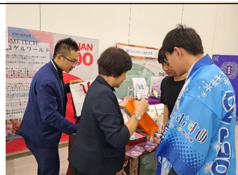
引導日方貴賓巡攤

27日下午除執行展攤活動，另於13時同步舉辦臺南觀光商談會，讓在地觀光物產業者與本市業者進行媒合交流，本次共邀集8家含旅行及物產業者之山交觀光、山新觀光、讀賣旅行山形營業所、山形中央觀光、米澤旅遊服務、一般社團法人上荷山觀光物產協會、農協觀光山形區域中心、山形藏王道之驛站。