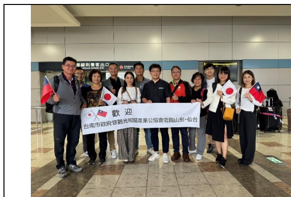
團隊抵達仙台國際機場

4月26日首日抵達日本山形市，即赴山形藏王道之驛站進行隔日場布事宜。本次共出展8格展位，2格為觀旅局(含臺南400專案辦公室)及農業局之臺南國際觀光與臺南400行銷、農特產展位。其餘6格由臺南市旅宿、觀光工廠、農產、伴手禮等業者使用。