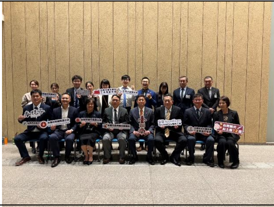
拜會山形市政府大合照