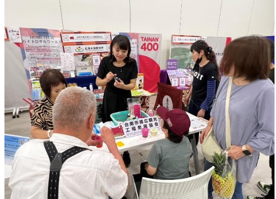
觀光工廠 DIY 活動參加民眾踴躍