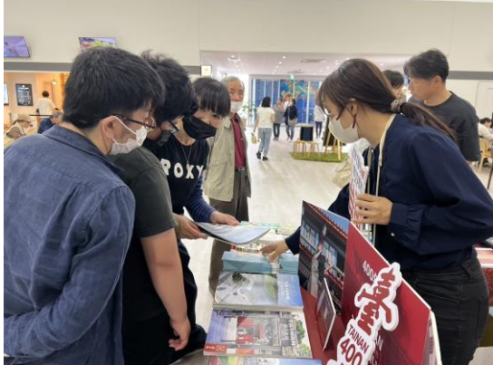
臺南觀光及臺南 400 文宣吸引民眾諮詢