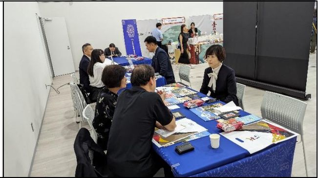
在地業者輪桌與臺南市業者交流 2