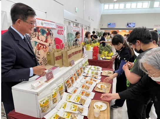
臺南果乾數百份 1 天半內完售