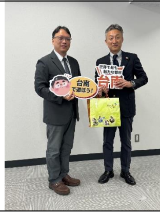
致贈臺南觀光文宣品及伴手禮