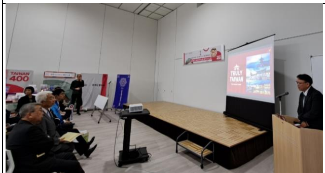
開幕式現場介紹臺南 400 與臺南觀光