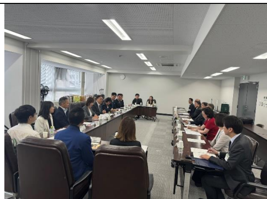
拜會仙台市政府與仙台觀光國際協會