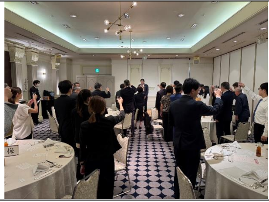
臺南市訪團歡迎晚宴大家共同舉杯