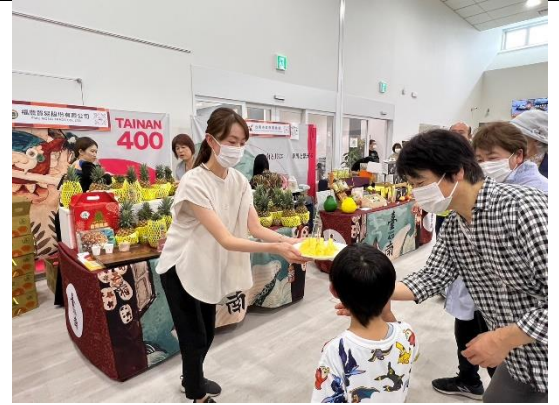
臺南鳳梨 100 箱 1 天半內完售

27 日傍晚，市府團拜會山形市政府後，另參加山形市方為本市業者舉辦之歡迎晚宴。山形市政府由商工觀光部高橋清真部長與觀光戰略課松澤聖課長、國際交流中心大沼裕子所長等代表接待本市訪團，另山形市議會則由長谷川幸司議長親自參與交流。