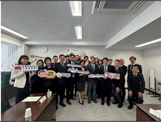
與仙台市方大合照