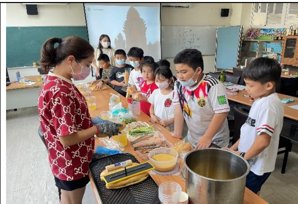
新市國小—體驗活動