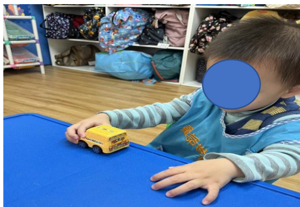
認知分測驗—能將車子前後滑動玩