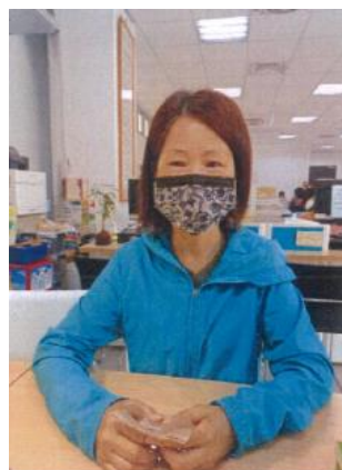
民眾受理法律諮詢服務