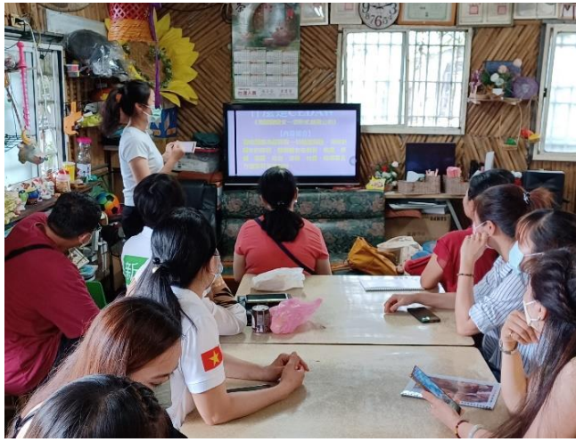
112/9/10 柳營衛生所-新住民性別平等與孕產婦衛生保健說明