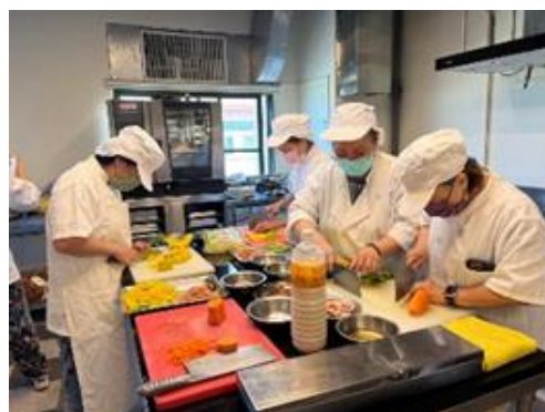
失業者職業訓練班-銀髮料理培訓班