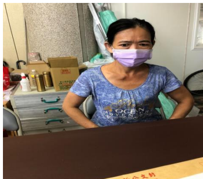
民眾受理法律諮詢服務