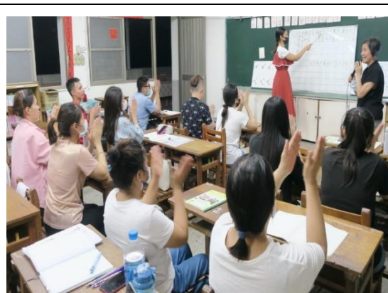
南區新興國小新住民教育班 —指認語詞