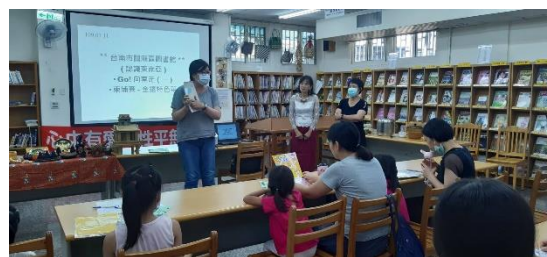
新住民子女早療教育服務