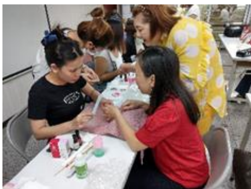
失業者職業訓練班-形象整體造型設計培訓班(新住民專班)