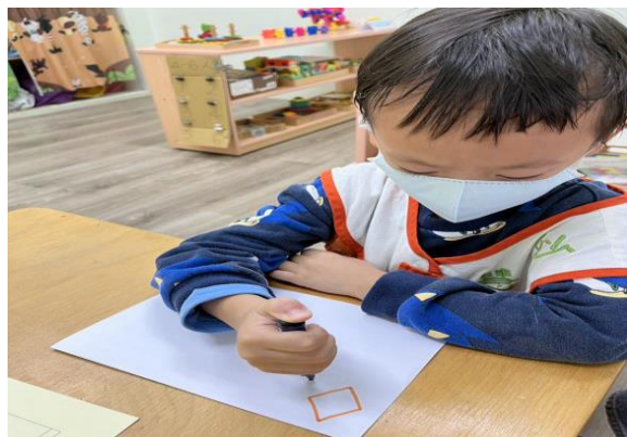
動作能力分測驗—能仿畫