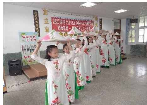
新住民據點文化交流活動