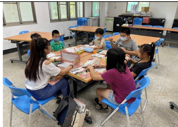
白河國小—語文學習