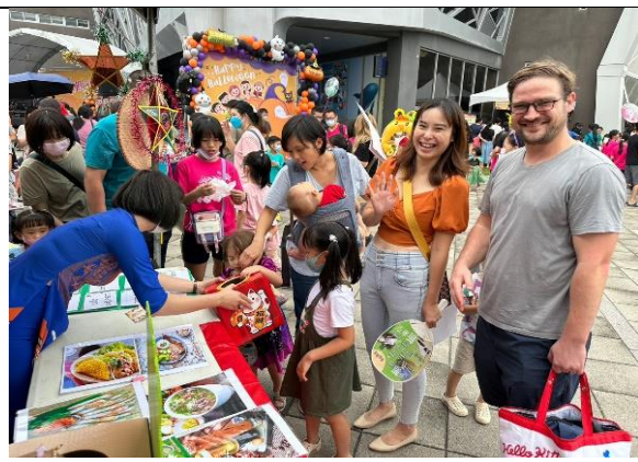
「新」心相連—甜蜜蜜家庭日

具體措施三： 辦理新住民之成人基本教育研習班，以培養文化適應及生活所需之語文能力，並進一步作為進入各種學習管道，取得正式學歷之基礎。