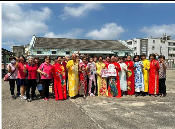
「我們是一家人」(學甲區農會)