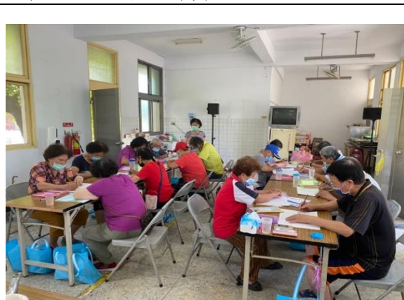
楠西國小成人基本教育班 —習寫國字