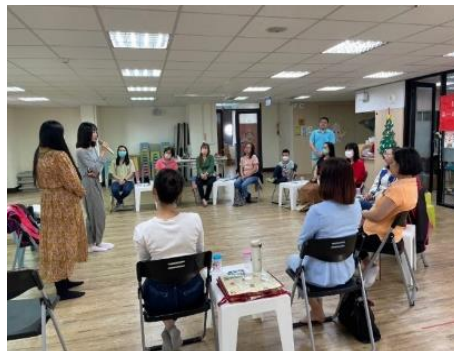
新住民通譯人才培訓服務