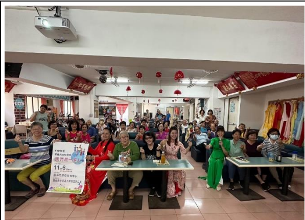
「我們是一家人」(中西區五條港里辦公處)