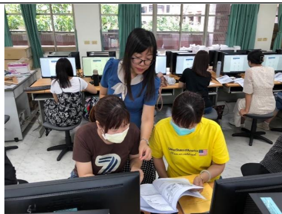
越南語教師手冊導讀