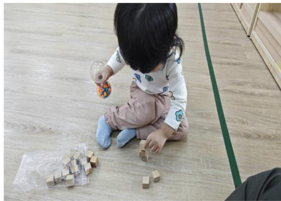
精細動作能疊高2個積木