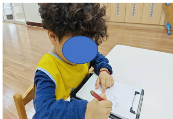
動作能力分測驗—能仿畫