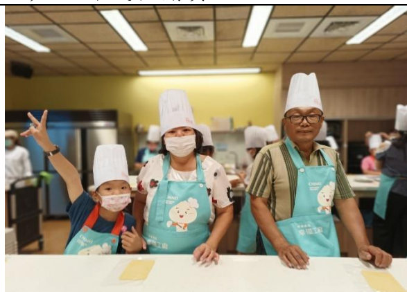
親子共學—愛的加油站