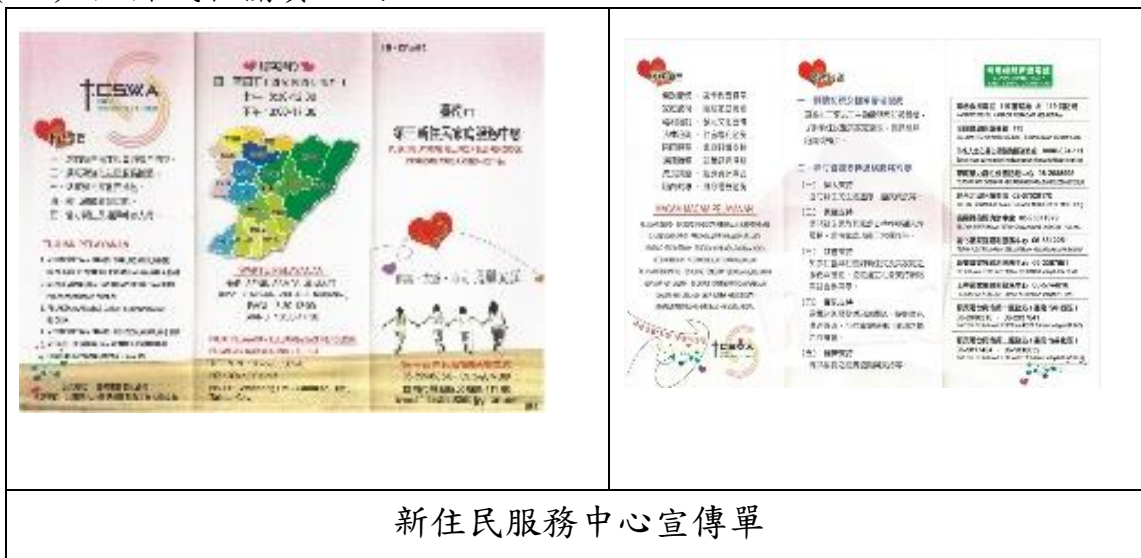
新住民服務中心宣傳單