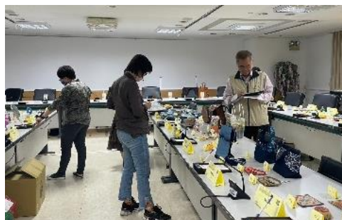
晴天坊於 11 月 16 日辦理下半年徵選活動