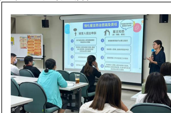
辦理就業平等暨性騷擾防治系列講座