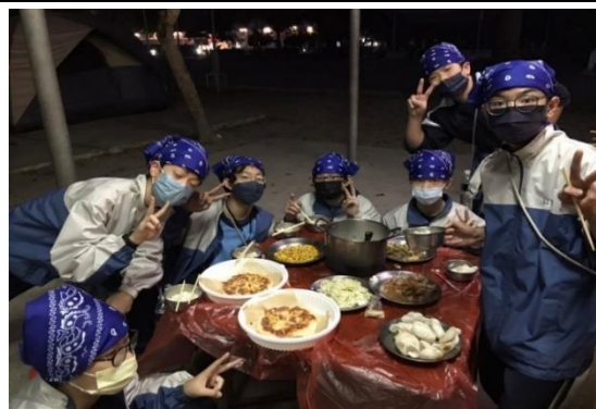
新興國中—露營暨異國料理體驗 (越南蝦餅、印尼炒麵)