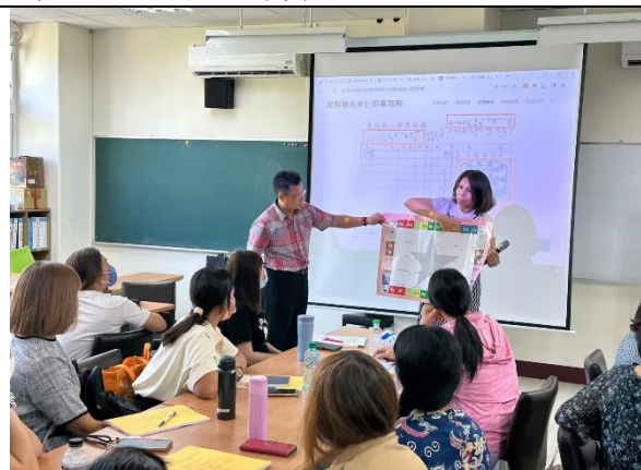
教具製作與學習教材教學應用