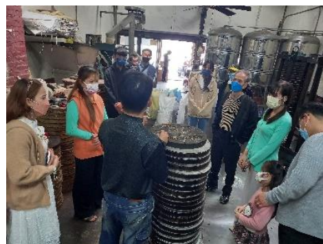
新住民據點文化交流活動