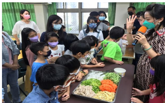
喜樹國小—異國美食介紹