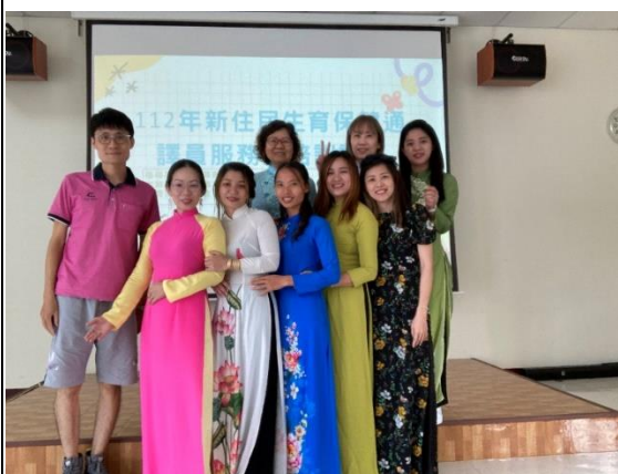
112/8/11 安平區衛生所-辦理生育保健通譯員初階訓練-結訓大合照