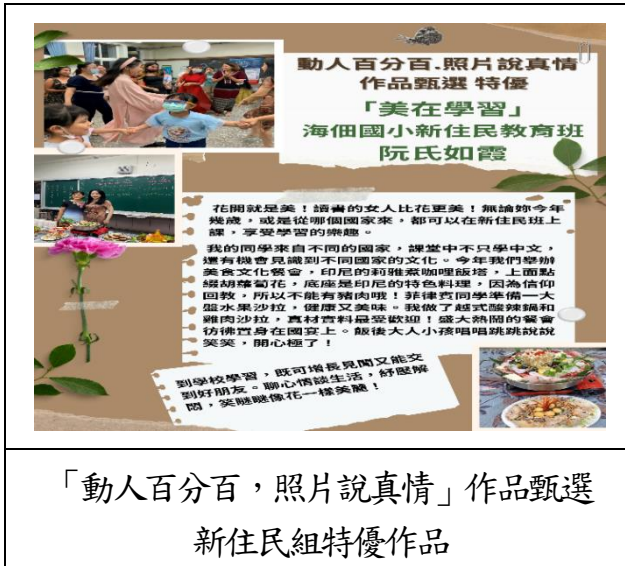
「動人百分百，照片說真情」作品甄選 新住民組特優作品