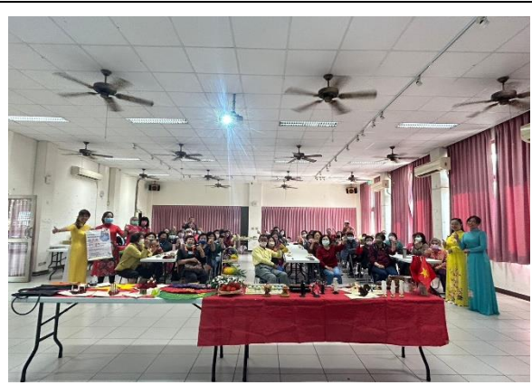
「我們是一家人」(將軍區圖書館)