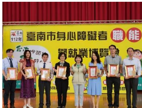
五心職場獲獎單位於身障就博會上接受公開表揚