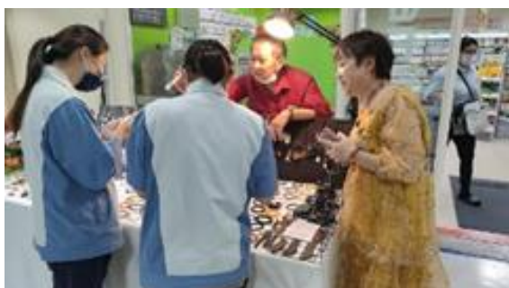
晴天坊參加住華科技-屋台市集