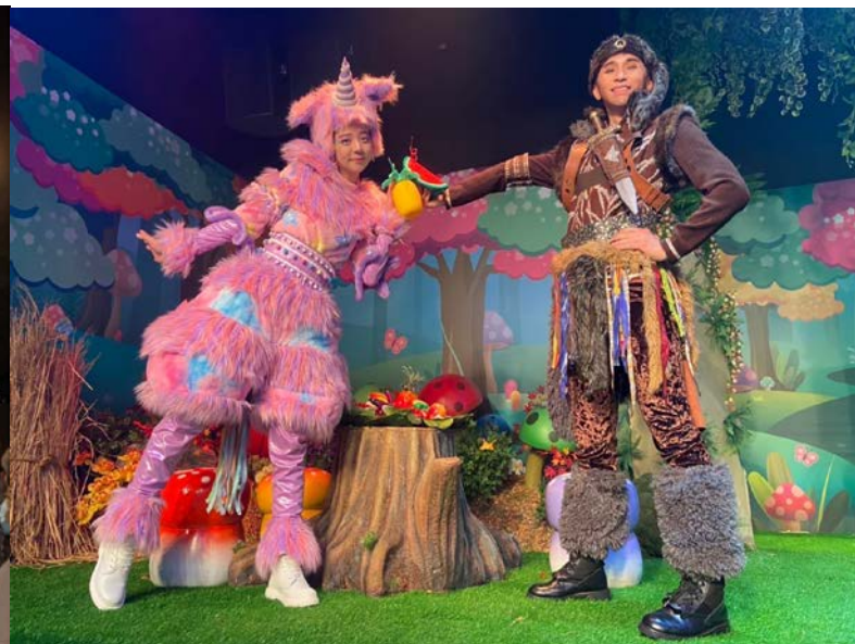
表演家合作社劇團