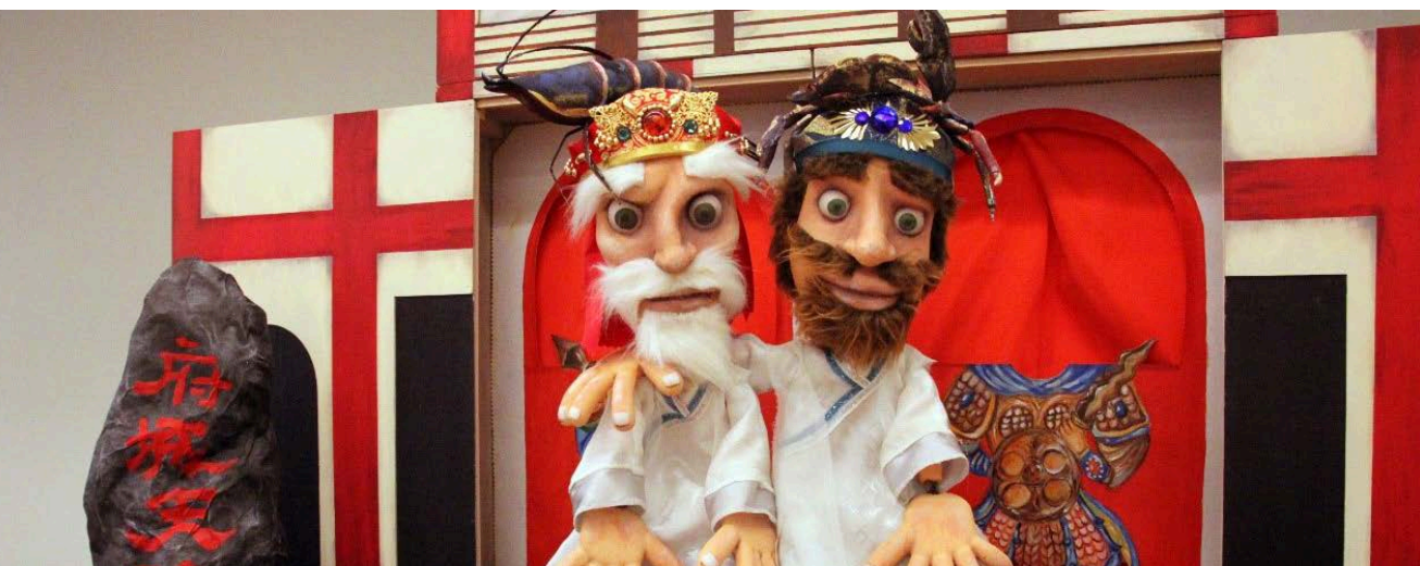
無獨有偶工作室劇團