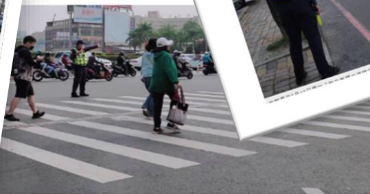
計90處行人交通流量最大之路口為重點執法處所

38日台南市發生孩童行走於行人穿越道上，因車輛未禮讓行人而撞擊死亡的憾事，為喚醒駕駛人停讓行人之守法意識，台南市警察局自5月10日實施「路口車輛未停讓行人執法」專案，將車輛行經路口或行人穿道不停禮讓行人列為執法重點，並列管轄內計90處行人交通流量較大之路口為重點執法處所，並於每日點時段(例如：上、下班車流尖峰、孩童上、下課、假日各觀光區尖峰等時時段)規劃勤務加強取締，統計：1日至14日，4項重點執法項目共計取締交通違規9,117件，其中路口不停讓行人共計取締592件。