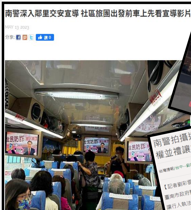
【新南瀛記者黃鐘毅報導】南市警察局為加強高齡長者對「大型車內輪差及視野認知，深入南市北區文成里，並與臺南監理站、臺南市政府社會局及南警第五分局，運用鄰里辦理遊覽車團體出遊前進行交安宣導，讓里民車上看宣導影片，下車