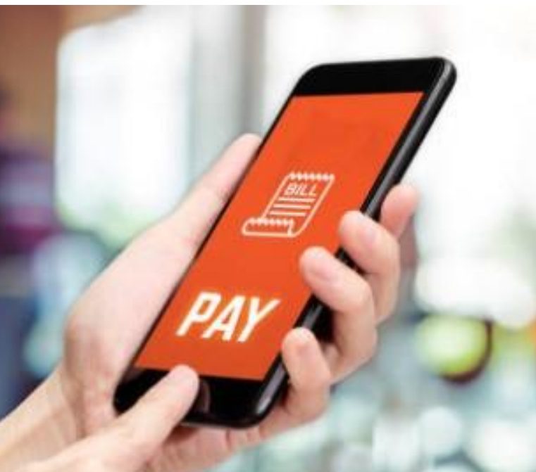
本府108-110年行動支付繳費總件數