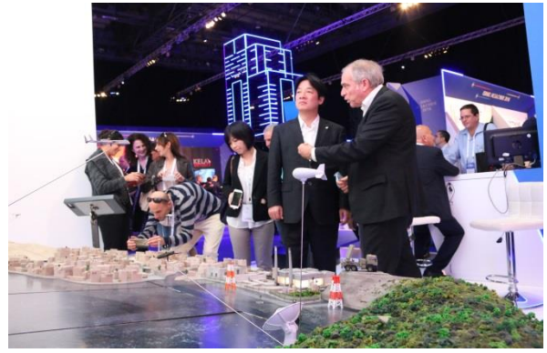
參觀國土安全會議展覽，賴市長認真聆聽參展廠商介紹 其智慧城市規劃