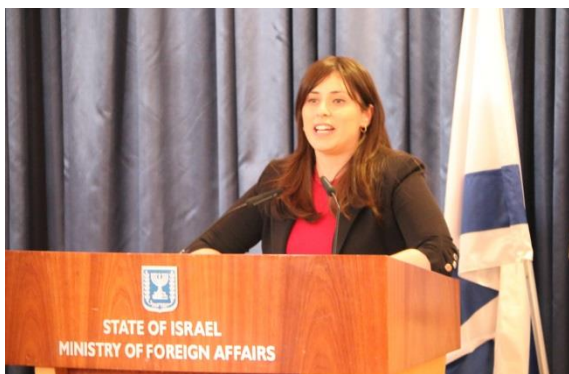
以色列外交部次長 Tzipi Hotovely 致詞