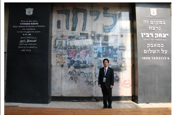
特拉維夫市政廳旁的以色列前總理拉賓遇刺地點