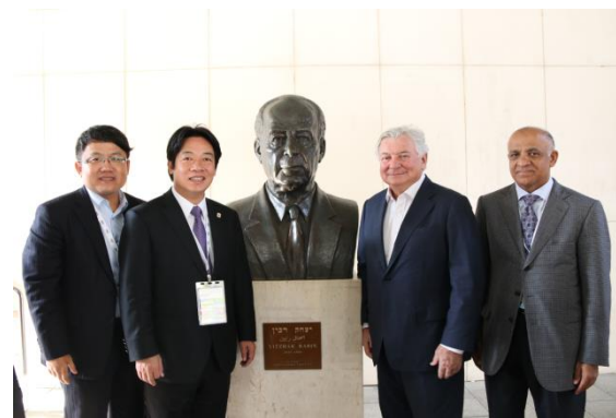
於拉賓紀念雕像前合影