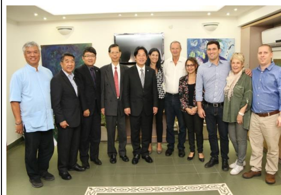
臺南市代表團一行與若娜娜市府人員合影