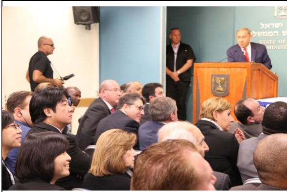
內坦雅胡總理回答賴市長的提問