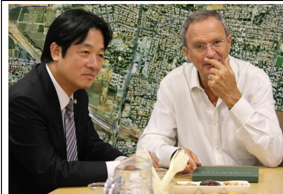
賴市長與若娜娜市 Ze've Bieski 市長交換市政經驗