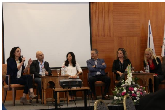
「城市如何鼓勵創新及永續討論會」邀請拿薩勒當地新創科技產業代表與談