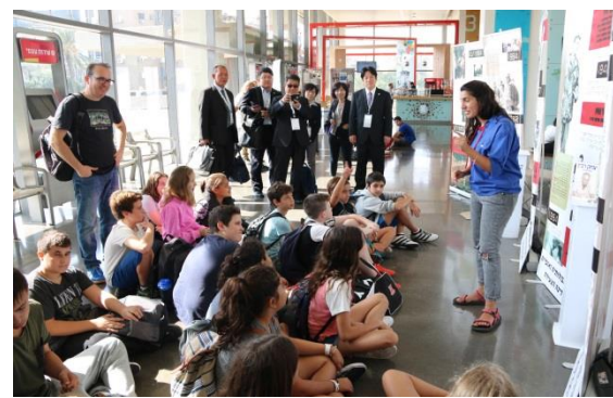
於特拉維夫市政府巧遇校外教學的學童