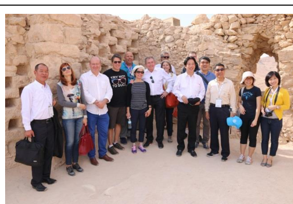
市長們於馬薩達國家公園合影留念