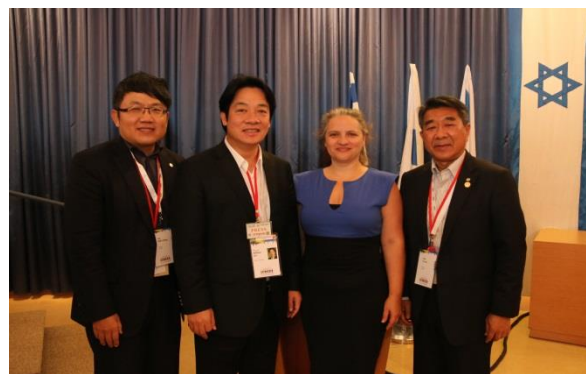
前任以色列駐臺代表何璽夢女士特別前來迎接