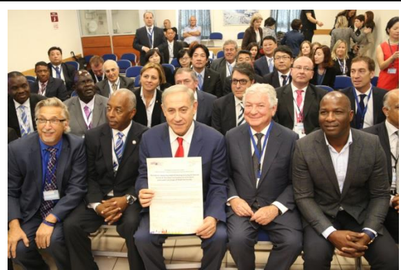
與會市長們與內坦雅胡總理合影