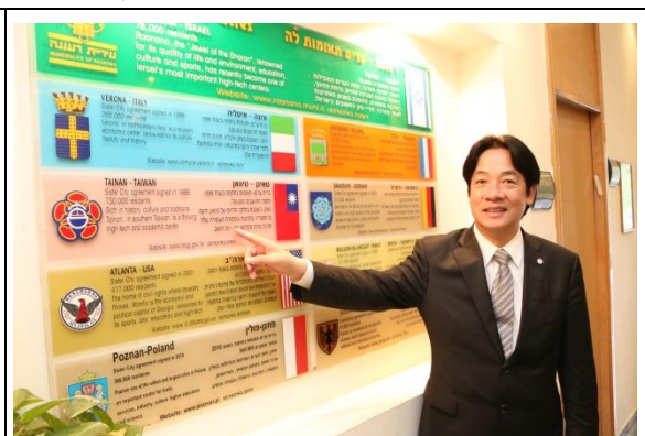
若娜娜市政廳 1 樓的姊妹市介紹