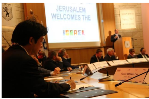
於耶路撒冷市政廳舉辦的圓桌論壇