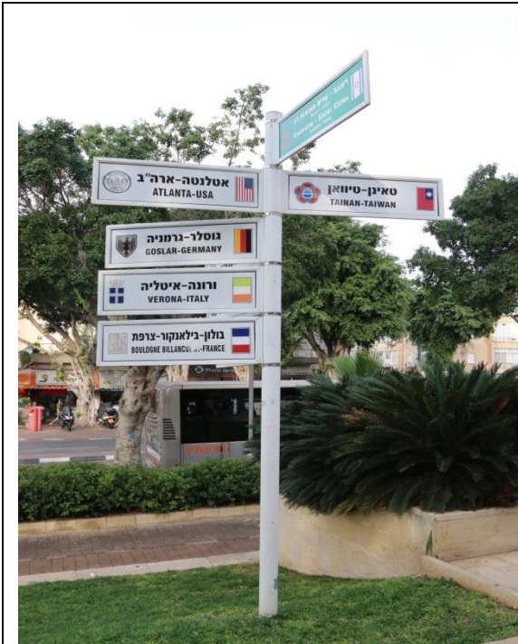
若娜娜市政廳外指著臺南市方向的指示牌