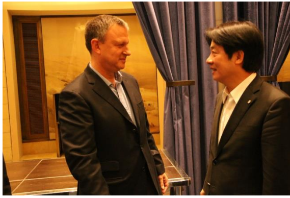
賴市長跟以色列國會議員兼知名創投家 Dr. Erel Margalit 交流意見