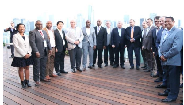
本次世界市長會議的與會市長共同合影