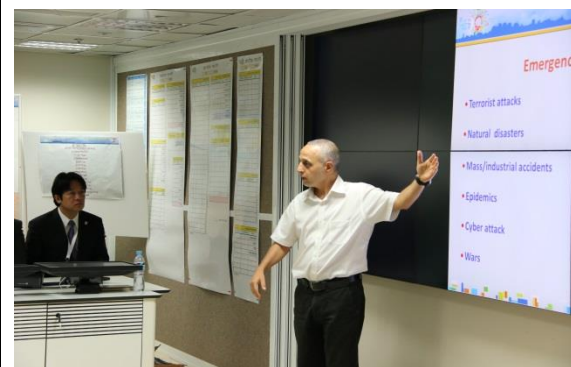
特拉維夫市政府控制中心人員簡報