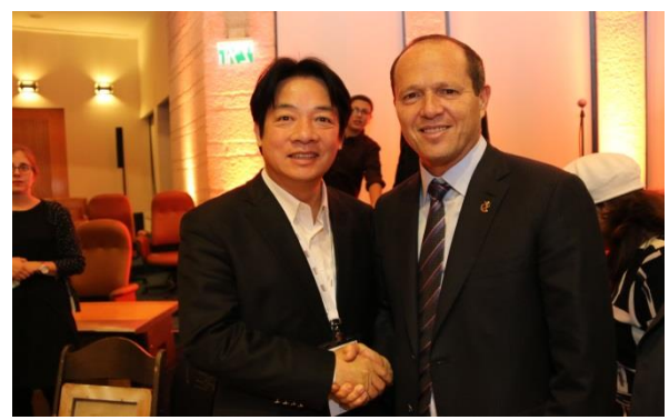
賴市長與耶路撒冷市長 Nir Barkat 合影