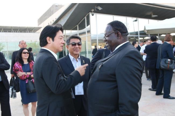
賴市長跟肯亞 Homa Bay County 市長 Cyprian Otieno Awiti 相談甚歡