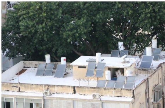
特拉維夫民宅屋頂均裝設太陽能板，可供洗澡用熱水