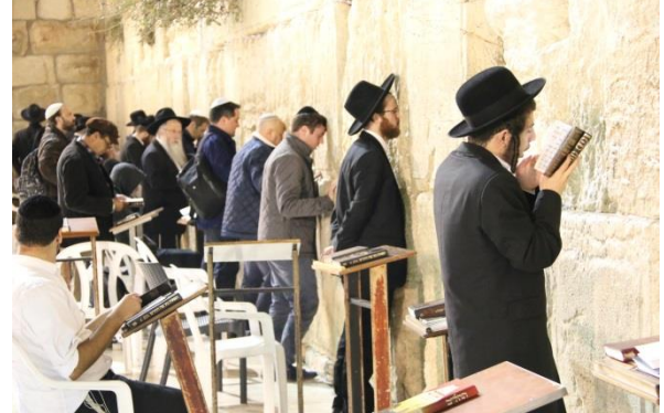
在耶路撒冷哭牆下禱告哀哭的猶太人