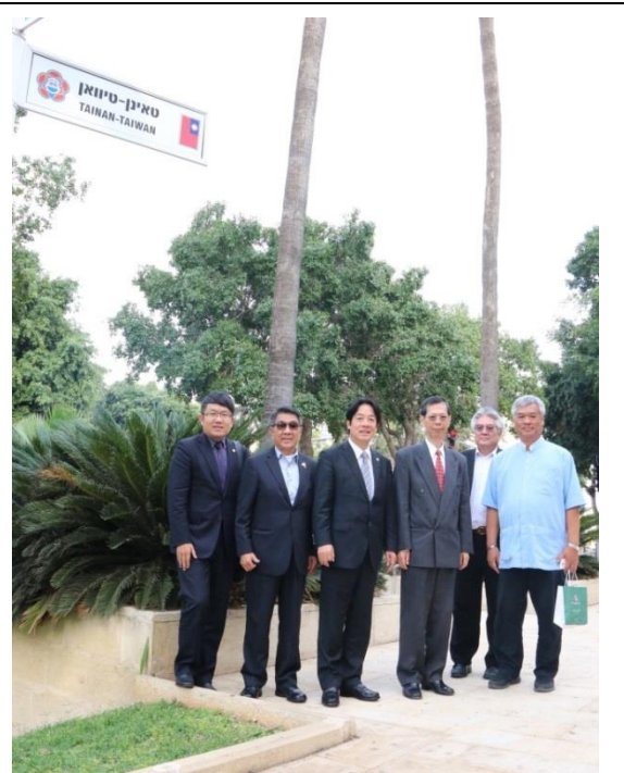
賴市長一行於指示牌下合影