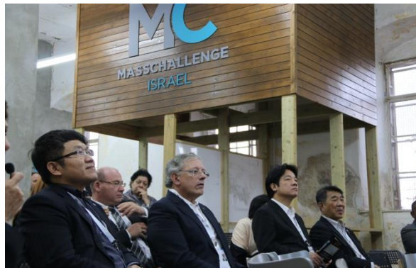
於耶路撒冷新創基地 Masschallenge 聆聽新創產業介紹