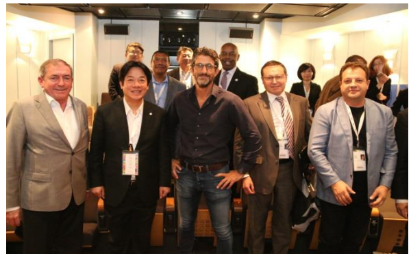
參觀 Bezeq Telecom 電信公司