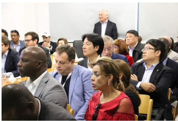
於新創公司 mPrest 聆聽簡報