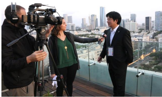
賴市長接受以色列當地電視台採訪暢談此行心得