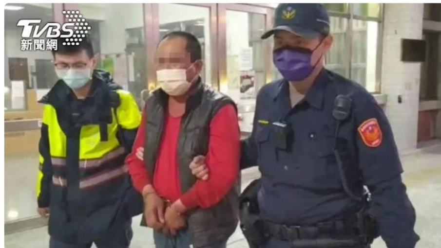
警方將潘男依殺人罪移送。

對於 酒駕再犯者 ，本局將以 不確定殺人故意移送 ，以示警察局對於反酒駕之決心。