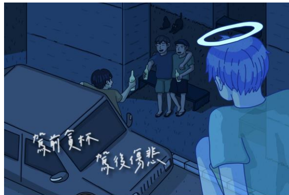
交通部安委會 臺南市政府警察局 關心您 (廣告)