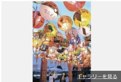
ギャラリーを見る

台湾・台南市の名物や文化を発信する台南フェアが30日、群馬県前橋市の道の駅「まえばし赤城」で始まった。特設ブースが並び、華やかなランタンが異国情緒を醸す = 写真。2日まで。