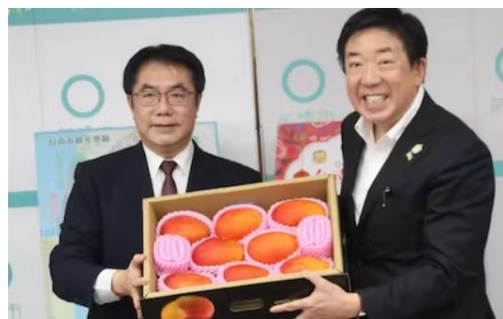
前橋市を訪問し、山本市長にマンゴーを手渡す台南市の黄市長（30日）

前橋市に3月に開業した道の駅「まえばし赤城」で30日、台湾南部の台南市の食や観光の魅力を紹介する「台南フェア」が始まった。これに伴い台南市の黄偉哲市長が前橋市役所を訪れ、山本龍市長を表敬訪問した。