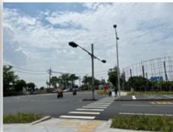
善化區目加溜灣大道與台19甲