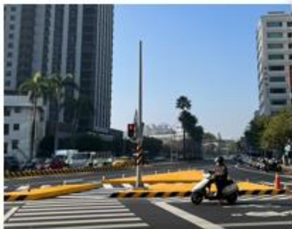
東區東門路與林森路口