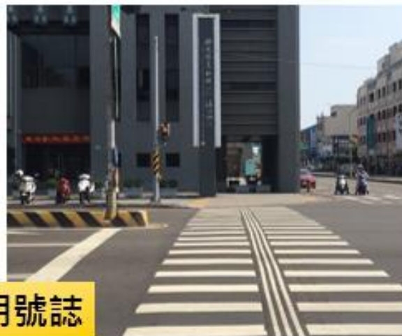
永華路二段/建平路口