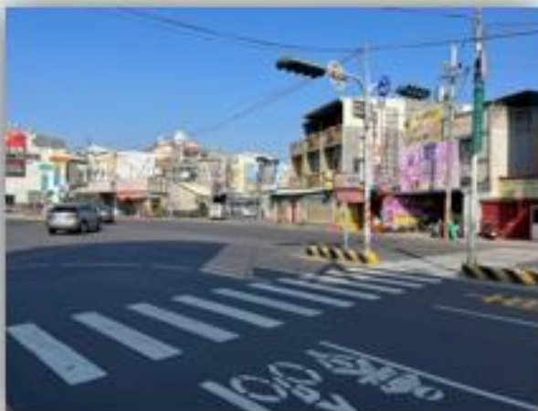
永康區永大路三段與龍埔街