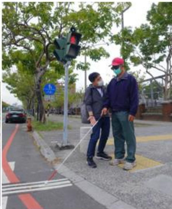
金華新路與府前一街路口 行穿線對齊無障礙斜坡