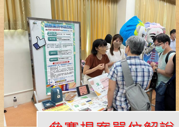
參賽提案單位解說