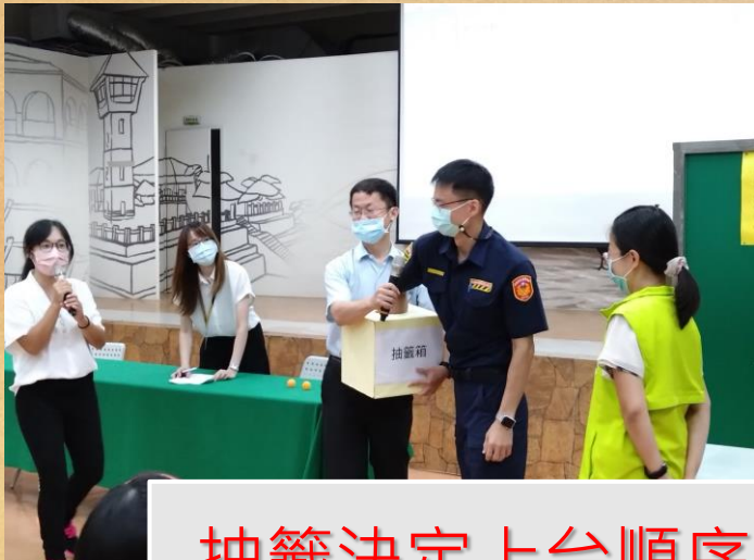
抽籤決定上台順序