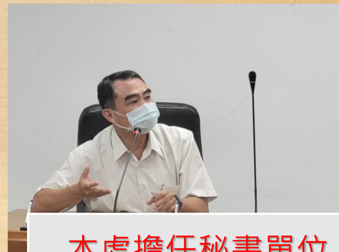
本處擔任秘書單位