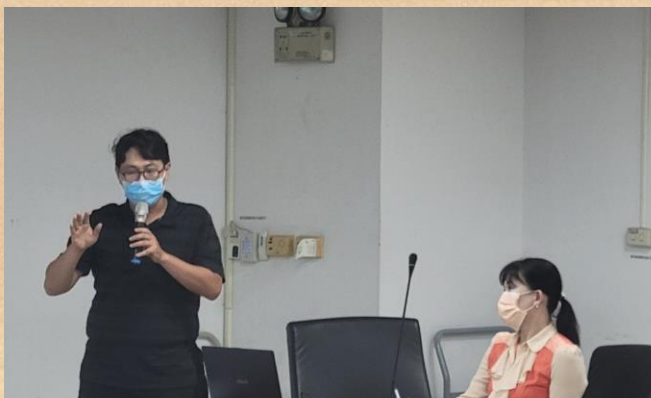
業務單位回應提案優點