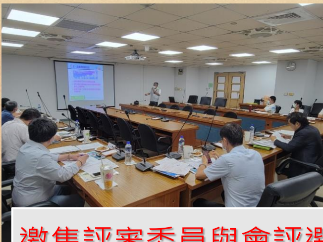
邀集評審委員與會評選