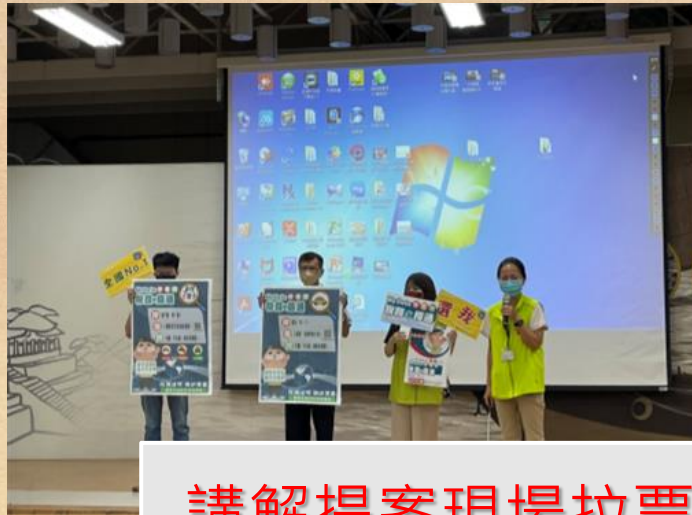
講解提案現場拉票