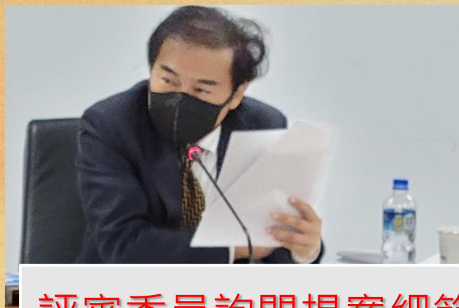
評審委員詢問提案細節