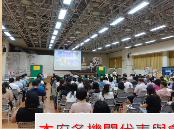
本府各機關代表與會