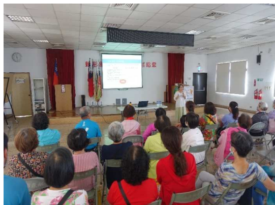
於農會辦理性平講座宣導