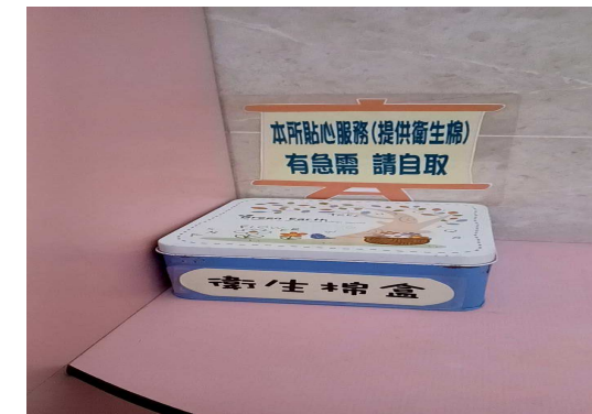
公廁放置生理用品提供民眾使用