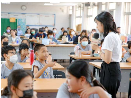
學校宣講月經教育課程