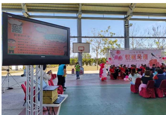
活動現場於電視播放登月計畫簡報