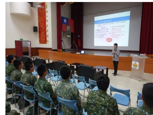
於軍方辦理性平講座宣導