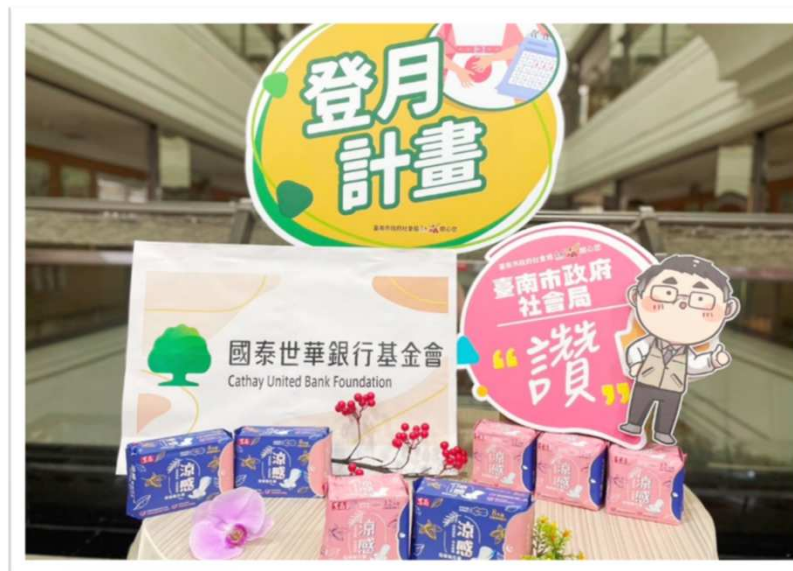
112年國泰世華銀行基金會捐助臺南市 政府社會局及教育局生理用品