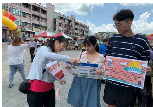
活動設攤向民眾宣導