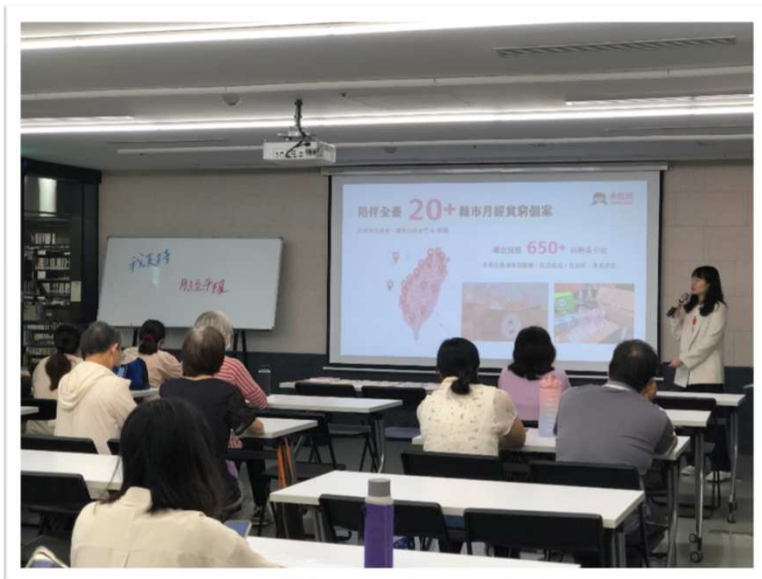
112年本府性別平等辦公室邀請 全球小紅帽協會辦理專題講座