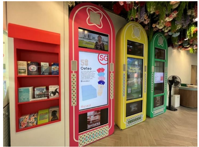
旅服中心互動設施值得參考學習