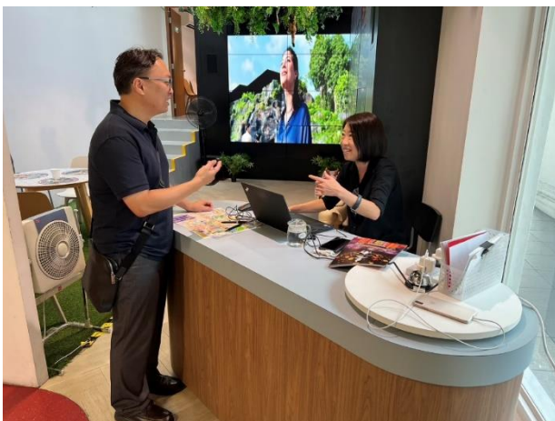
旅服人員向本府觀旅局說明服務狀況