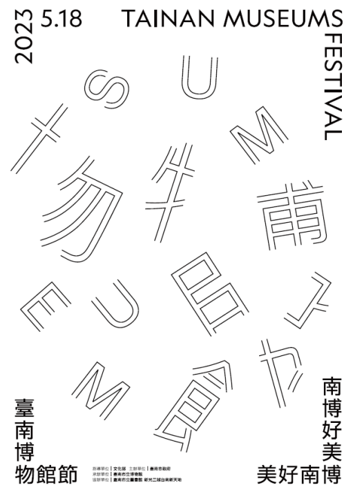
透明(實體)及鏡面版(市府一樓大廳輸出)