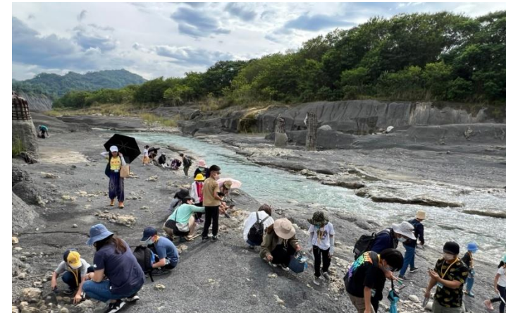
菜寮溪採化石 認識土地與流域(左鎮化石園區)