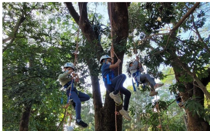
攀樹體驗 學習與自然共存(山上花園水道博物館)