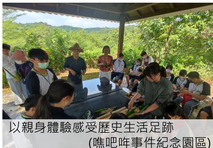
以親身體驗感受歷史生活足跡 (噍吧哖事件紀念園區)