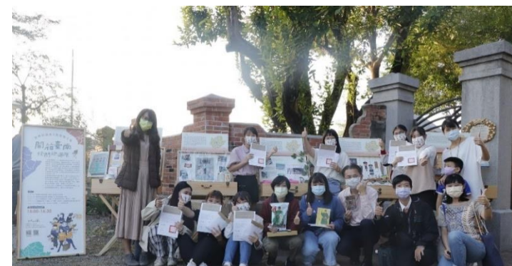
重複使用之展示箱將博物館帶到各地 (臺南市立博物館)