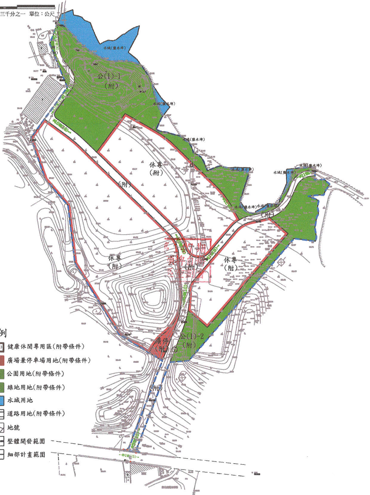
臺南市新化區礁坑子段自辦市地重劃區 重劃區範圍現況都市計畫套繪圖