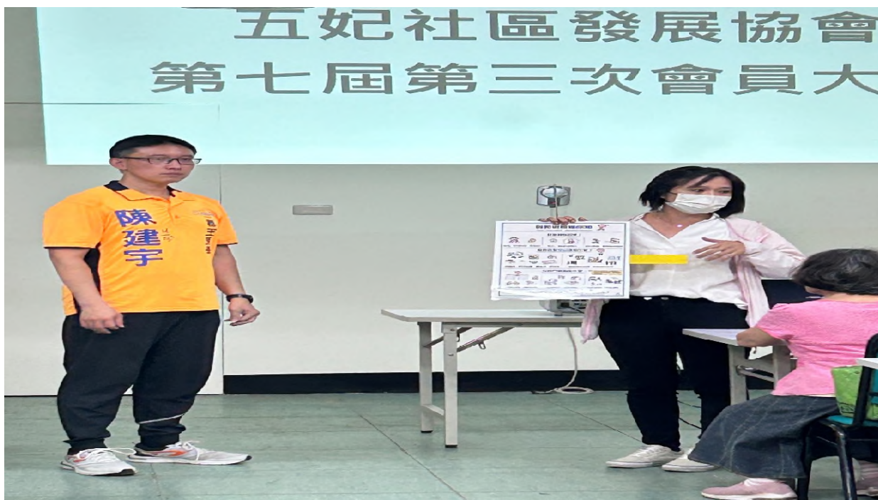
利用文宣宣導性別平等觀念