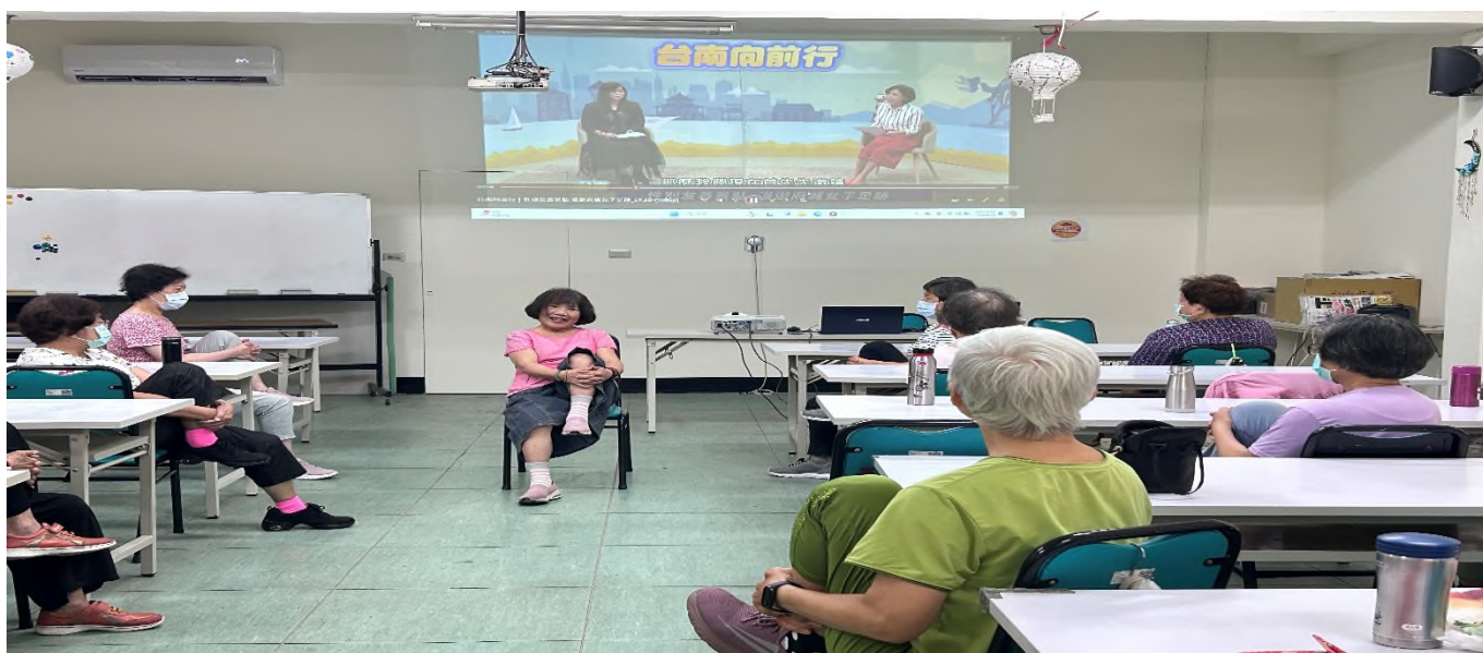
利用影片宣導性別平等觀念