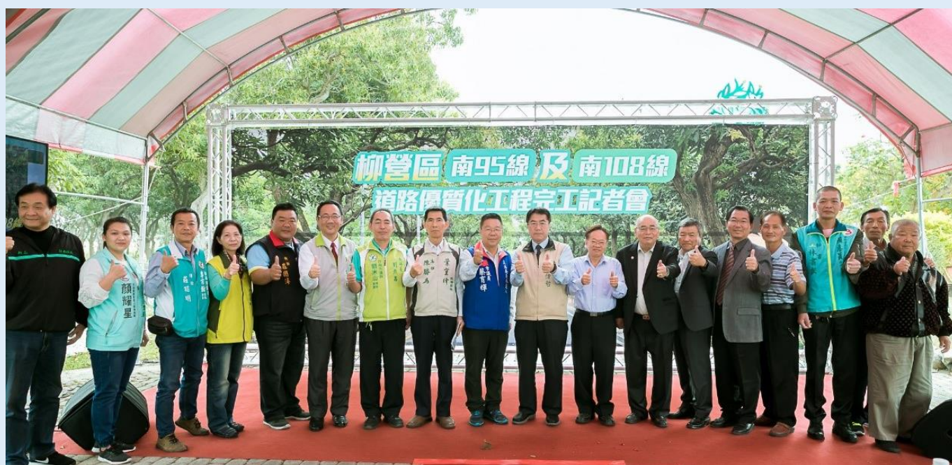
照片 2、黃市長偉哲與在地議員及鄉親合影

義士路優質化工程完工後，除大大提升道路服務品質，加上植栽景觀美化，蛻變為美麗觀光隧道，而夜晚也變得更加迷人，時常可以看到喜愛路跑的居民在夜光景緻下享受流汗。