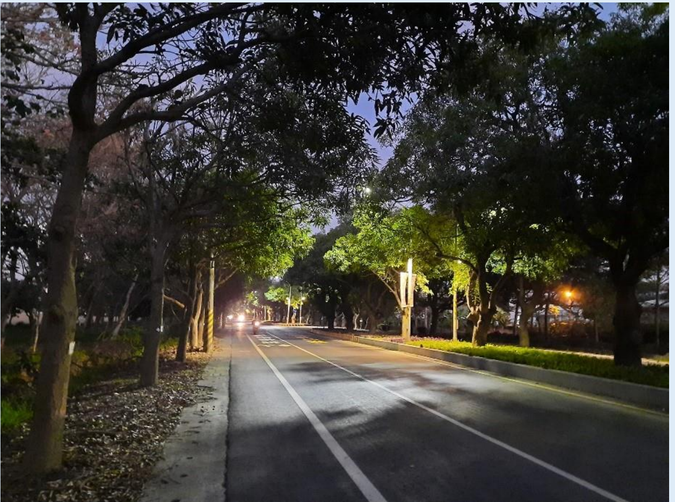
照片 1、綠色隧道夜景

臺南市柳營區「太康綠色隧道」義士路道路優質化工程完工了！義士路工程除了強化路基增加耐用度把道路鋪的更平穩、漂亮，更增添許多巧思，且參考其他先進國家使用綠色材料轉爐石，更為環保盡一份心力。