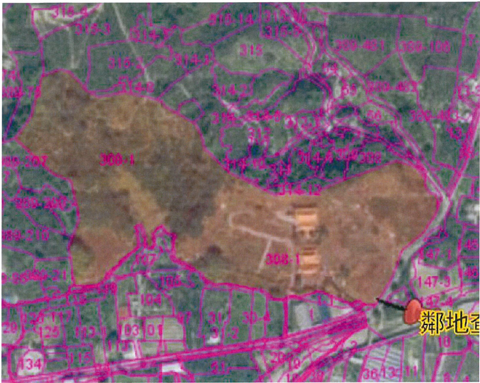
集集鎮柴橋頭段北勢坑小段308-1地號