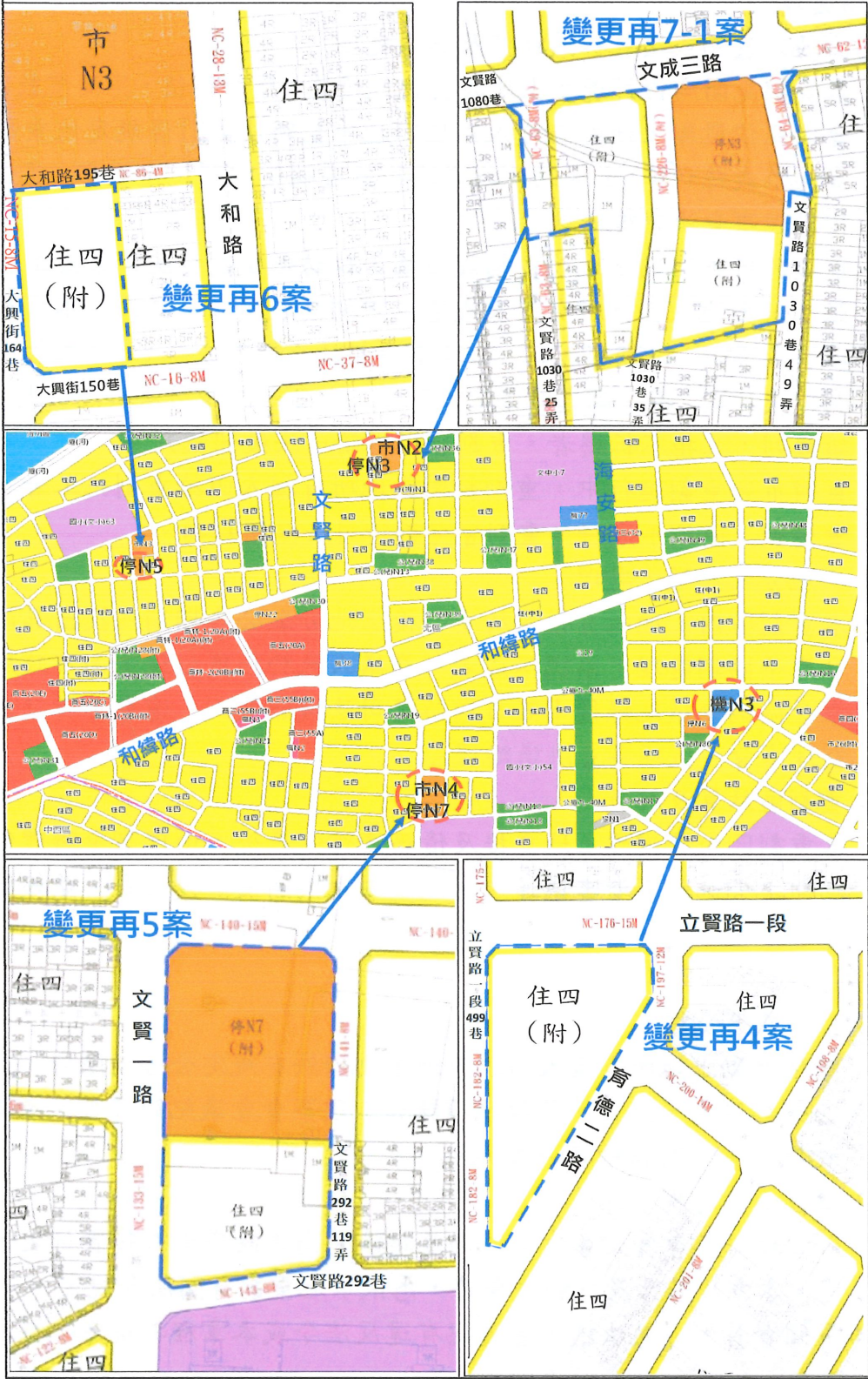
重劃區範圍圖 (示意圖)