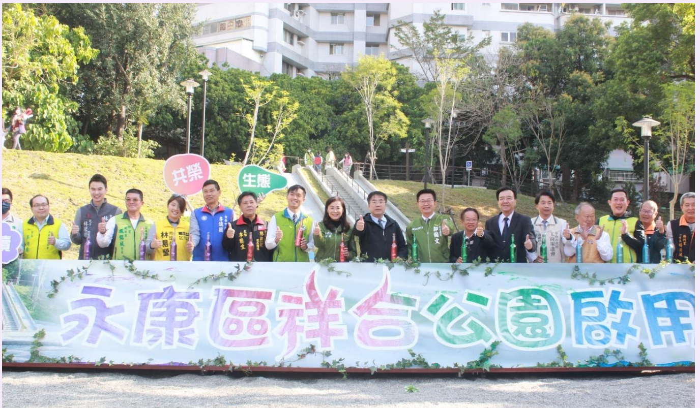
照片 1、109 年 2 月 3 日，市長主持公園啟用典禮

臺南市政府非常重視公園在都市空間扮演的角色，並要求工務局積極打造特色公園，工務局在永康區開闢祥合公園並設置共融式遊戲場，讓市民朋友不分年齡都可以享受溜滑梯的樂趣，並配合現地地貌規劃為山水景緻公園，一圓當地居民 20 年來的公園夢。