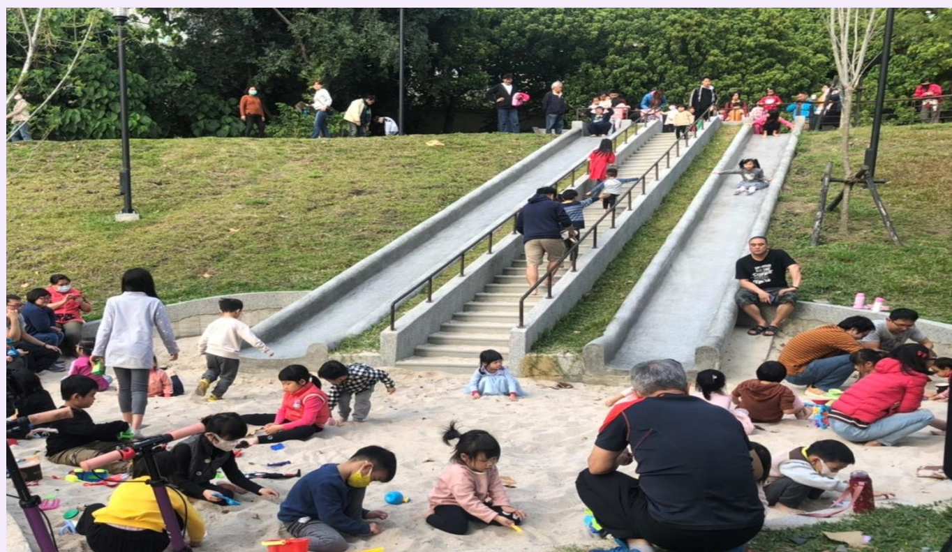
照片 3、公園使用狀況