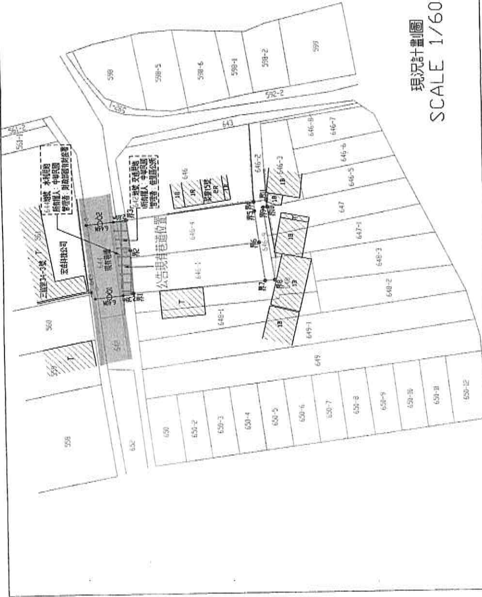
現況計畫圖 SCALE 1/600