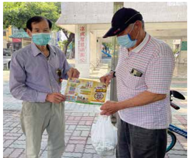
郭里長發放滅鼠藥給里民

郭里長深具同理心，總是尋找機會及資源協助中低收入者等弱勢家庭；在新冠病毒防疫期間，郭里長也主動關心居家隔離的里民。郭里長認為社區服務工作是永無止境的，他秉持感恩、報恩的心，不斷思考社區興革的待辦事項，努力使福壽社區精益求精，好上更好。