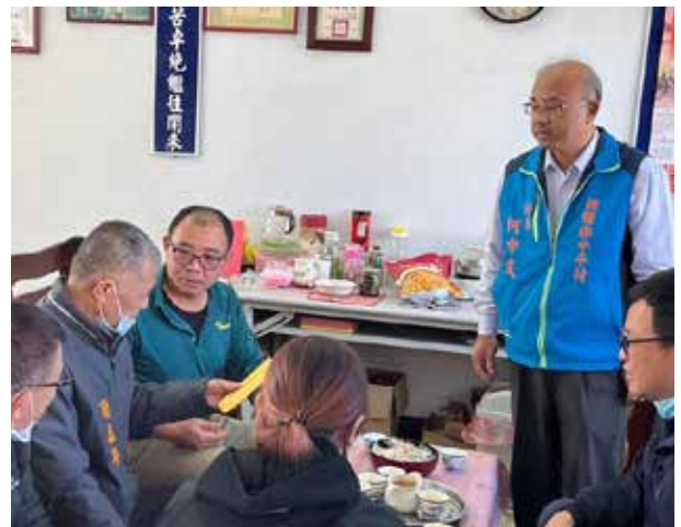
何村長與公所、慈善機構商議救助村民事宜

何村長一步一腳印，努力實踐對村民的承諾，將「雙腳走得到的地方，我就能做到」的精神奉為圭臬，致力擔任村民與鄉公所間的橋梁，確實反映輿情需求，提升村民生活品質，造福桑梓不求回報，深獲村民肯定。