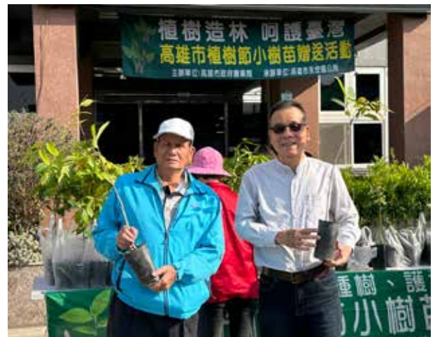
林里長發放樹苗推動環境綠美化

林里長秉持著勤勞、骨力打拚的精神守護鄉里，服務不分族群，林里長每每走訪鄰里總是聽到里民對著里長說「有你真好」。