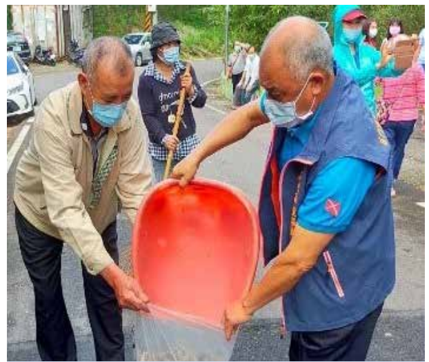
曾里長號召里民參與環境清潔

曾里長曾擔任石門區里長聯誼會會長，在擔任會長期間鼓勵石門區各里里長支持政府政策，對於政府各項施政措施更是全力配合並致力落實，且用盡心力調和各里長意見。曾里長也曾兼任寺廟管理員及農會理事長，時常為寺廟及石門農民努力奔波。曾里長 40 年來始終抱持「服務用心、照顧細心」的態度處理里內事務，總以居民福祉為己任，其無私無我、盡心盡力為民服務的精神令人敬佩。