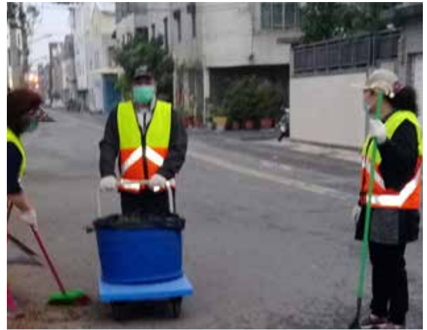
陳里長和志工每週清掃里內道路