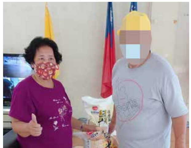
陳村長發放物資給弱勢村民

五峰鄉因地形落差大，河流的坡降也大，特別是在春夏之交、梅雨季及夏季時期，大雨經常造成山洪和土石流，並造成道路坍方落石，危及到村民生命財產安全。陳村長為防範雨水帶來的災害，平日即做好災害預防教育訓練，成為主動型的災害管理者。當災害發生時，陳村長都會與鄰長一起巡視災情，設置安全防護，先行初步排除障礙後，儘速聯繫公所或相關單位，請求更進一步協助或疏散村民到安全的地方，並且清理坍方落石，讓返家的學生與村民能有安全回家的路。