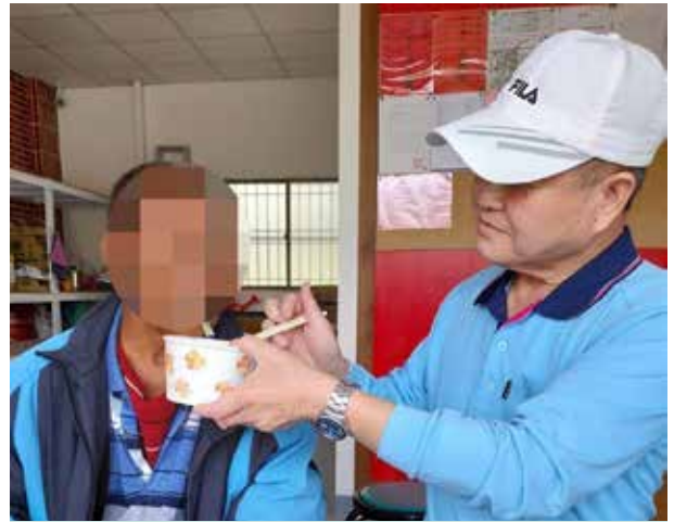
陳里長協助行動不便長者用餐

布袋里里民多務農為生，農路是里民日常生活及農產品運輸主要道路，由於里內農路曾經龜裂不平，缺少排水系統且易淹水，陳里長任職後便積極爭取經費改善，提升農路品質，並增設擋土牆，提升農民安全務農環境及農產運輸效率。對於里內道路多蜿蜒曲折，陳里長亦爭取增設反射鏡及路燈，並定期偕同環保義工擦亮每一片反射鏡，守護里民行車安全。陳里長多年來付出，里民皆有目共睹、感佩於心。