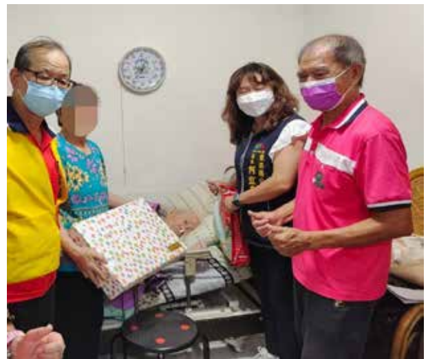
張里長關懷訪視百歲人瑞

除了社區環境的改變，張里長也成立關懷據點，安排課程活動鼓勵長者參與，利用長者農場栽種的蔬菜提供關懷據點餐點，並帶領愛鄰守護隊志工關心社區內獨居老人、身障人士，協助改善生活困境，並在歲末舉辦寒冬送暖活動。例如里內有年逾 99 歲的獨居老人因長年臥病在床，需人陪伴，張里長經常到府關懷，也會定期陪同就醫，並告知如有緊急事故時，請鄰居協助並立即通報里長前來緊急處置，幫助個案改善獨居單身、體弱臥病在床的困境。當里內遇有亡故家庭，張里長知情後，馬上伸出援手給予慰問協助，尤其對弱勢家庭更是免費協助辦理身故者後事。