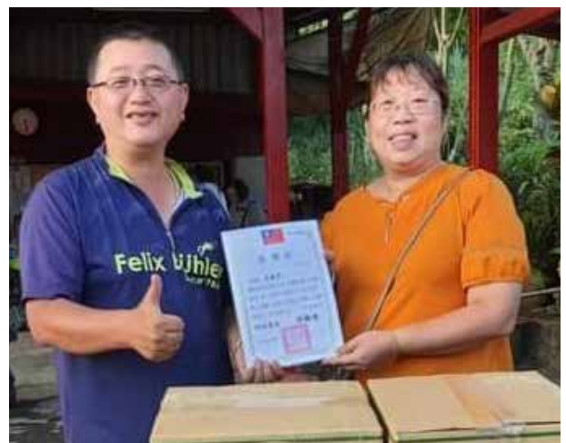
邱里長發送慰問米糧給里民

在新冠肺炎疫情期間，除了時時戮力於里內環境清消，邱里長還協助公所提供疫苗接種站場地，率領志工一同在疫苗接種站服務民眾，也協助發放快篩試劑及物資至確診隔離者家中。儘管接觸大量民眾有高度風險，邱里長仍不畏疫情嚴峻盡心盡力為人民服務。