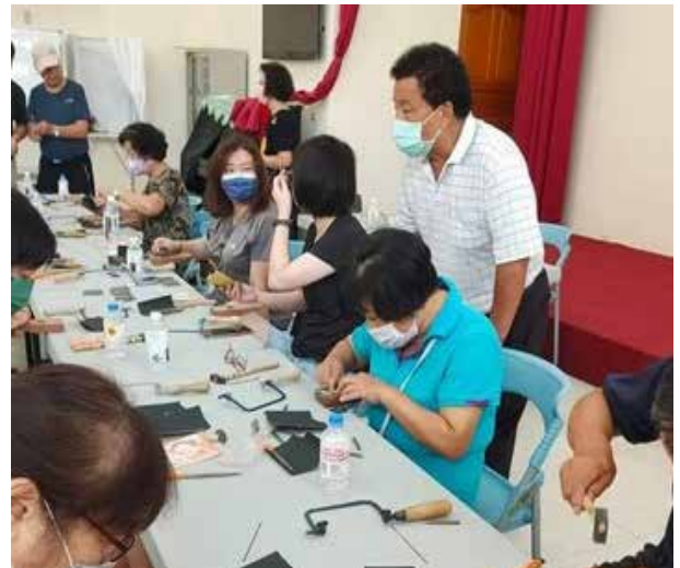
吳里長舉辦自製手工銀戒活動與里民同樂

吳里長勤於服務里鄰，時常關心未符合低收入戶之清寒家庭，若里民家中有急難事由需要幫忙，里長皆義不容辭地前往協助，並持續關懷里內百歲人瑞，於里內舉辦活動時，皆邀請一同參加，以表尊敬。另外，吳里長也常透過舉辦各項活動，拉近與里民之間情誼，豐富里民的生活，並進而瞭解里民需求，解決里民各項問題。