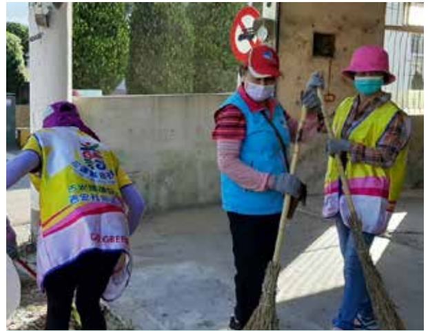
田村長與村民一同清掃社區環境

田村長希望社區環境清爽宜人，所以努力投入綠化工作，並經常與志工清掃家園，有她一步一腳印地守護吉安村，村莊已經逐漸蛻變成寧適美質的美麗吉安。