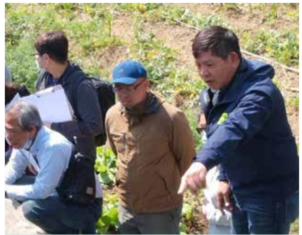
邱里長(右1)出席大排水溝工程會勘

邱里長並未因里內環境工作而疏於關心里民，例如邱里長時常到里民家協助辦理社會福利申請事項；遇里民中風生病或是發生交通事故，都會先行慰問；里民有經濟困難無力負擔醫療費用，邱里長會幫忙申請救助或津貼，減輕里民的壓力；對於無力殮葬的低收入戶，邱里長會協助喪葬事宜，讓往生者走得尊嚴；在歲末年終，邱里長總是會辦理冬令救濟，募集生活用品送給里內清寒家庭，希望能過個好年。