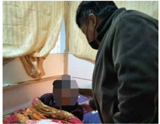
黃村長登門探視村內長者

黃村長熱心服務村民，在推展村內業務、執行縣政府及鄉公所交辦事項均親力親為、善盡職守。