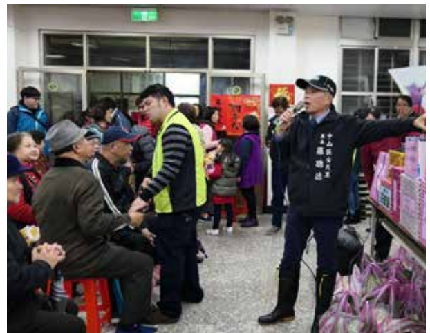
羅里長(右)舉辦節約用電宣導

安民里為住商混和區，居民多住巷道，過去曾有路人任意在巷道內丟棄垃圾的情形，羅里長重視里內巷道環境整潔，常於里內巷道張貼「請勿亂丟垃圾」等宣導標語以提醒路人注意，里內巷道亂丟垃圾現象已改善許多，羅里長也不定期僱工清洗里內之巷道路面及水溝，自身也投入協助清洗，以維護環境整潔。