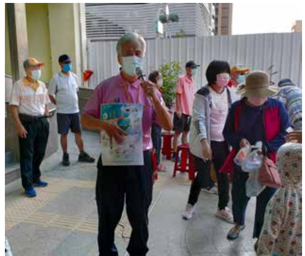
郭里長出席節能宣導活動

郭里長遴選鄰長，兼顧性別平等政策，15位鄰長中有7位是女性、8位是男性，更提倡家事大家做，不分男女老幼，鼓勵里民發揮專長互相幫助，每年也透過睦鄰健走、里民節約用電宣導暨生態參訪，增加里民交流互動，凝聚彼此情感，更能在配合市府或區公所宣導政令時，積極響應，與政府共同營造安和樂利的環境。