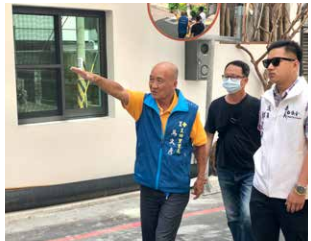
馬里長會勘里內道路及排水溝

馬里長平時勤走於里內，積極關懷里內弱勢民眾及獨居長者，給予適當的幫助與慰問。疫情嚴峻期間，馬里長逐戶發放疫苗接種通知單，鼓勵長輩接種疫苗及做好防疫措施以提升自我保護力，即使過程中意外遭狗咬傷，仍堅持做完工作，充分表現其敬業的態度。馬里長長期以來對王田里的用心與努力，深獲里民的肯定。