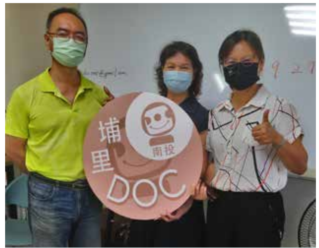
黃里長爭取建置埔里數位機會中心

110 年埔里數位機會中心正式營運，黃里長爭取開設蜈蚣社區活動中心教室，提供偏鄉居民更便利接觸資訊的公共場域，讓里民們能夠就近參與數位機會學習課程，包括健康、生態、文化、理財及電腦等豐富課程，拓展里民數位知識及視野。地處偏遠的蜈蚣里，經過黃里長多年努力經營，已變成生態資源豐富，友善宜居的好地方。