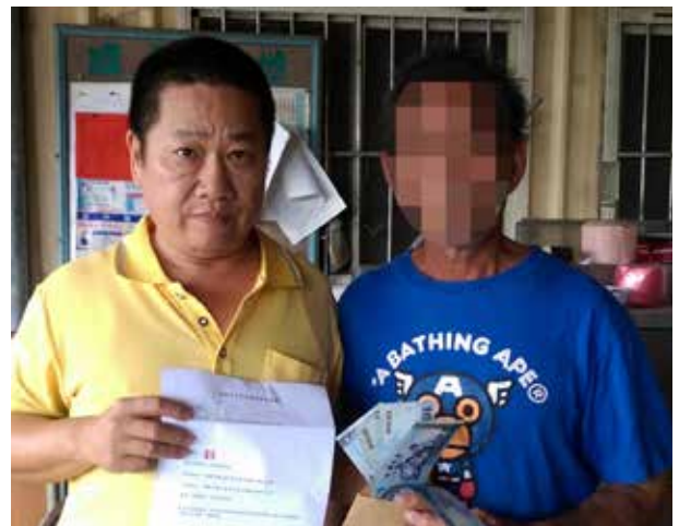
郭里長親自致贈里民急難救助金

中正里位於旗山區北端，郭里長希望能讓外地來的遊客對此處留下深刻印象，盡心盡力維護里內環境與市容，無論是協同環保局清潔隊勘查，或巡視里內雜草，皆事必躬親，經常率領社區志工及鄰長定期進行環境整頓、登革熱巡檢工作。在里民眼中，郭里長凡事親力親為，即使已連任多屆仍不減熱忱，服務口碑廣受好評。