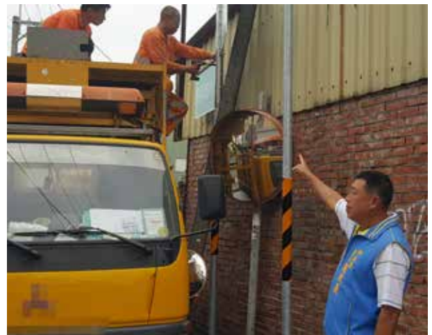
鐘里長爭取在里內路口巷弄增設路牌號誌

鐘里長非常注重居民的健康與安全，舉辦健康講座、安全教育講座，提高居民對自身健康和意識，並藉此凝聚里民向心力。鐘里長以竭誠的心，貢獻一己之力，期許在中央里這片土地上，里民皆能安居樂業，幸福平安。