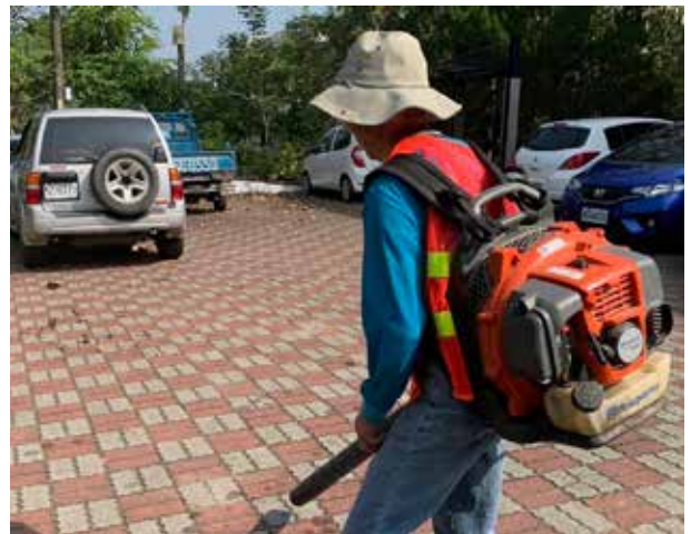
林村長每月定期環境清潔

林村長上任後積極爭取經費修繕維護山區道路、擋土牆、路燈照明、反射鏡等基礎設施，並爭取在無自來水地區引進自來水管路。村內山區另有潛勢土石流區，6 至 10 月梅雨颱風季節常有豪大雨及午後瞬間極端大雨，皆易發生土石流，林村長為強化山區村民防災認知與災害發生應變能力，親自帶領村民參加自主防災社區演練，並榮獲農委會水保局 109 年度優質自主防災社區銅質認證。林村長自任職以來，熱情、用心服務，爭取地方發展建設，將石碇村營造成優質的居住環境。