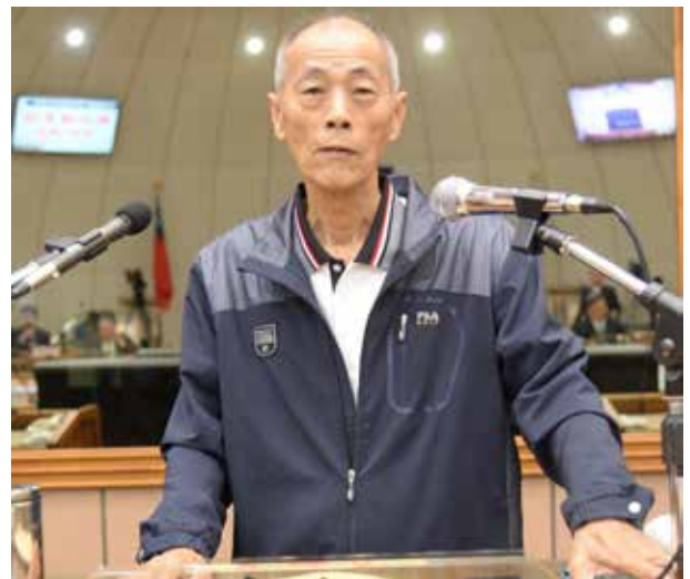
陳議員於議會質詢

陳議員說，40 多年的時間，轉眼即過，但他為民發聲、為民服務的初衷，始終不曾改變。