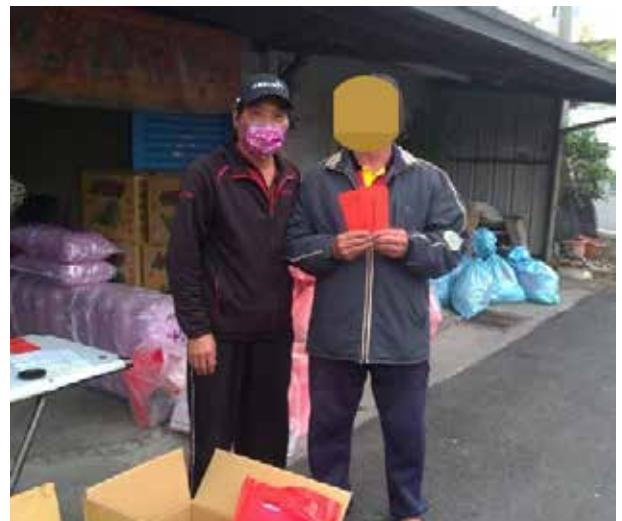
王里長寒冬送暖讓弱勢里民平安過好年

王里長說，里長的工作要面對各式各樣的人，無法選擇「顧客」，但可以選擇做好里長該做的事，凡事秉持服務的熱忱，設身處地去做，不論最後結果如何，里民都會感受到，而里民的衷心感謝就是從事里長工作最大的成就感與快樂。