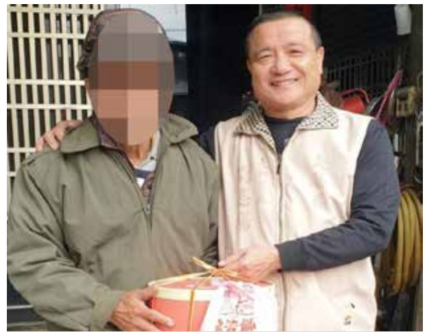
劉里長親送生日蛋糕至長者家祝壽

另外，劉里長也配合公所宣導，加強維護環境衛生，消除環境髒亂，全面檢查並澈底清除積水容器，杜絕病媒蚊孳生源，達到「容器不積水，病媒蚊不孳生」降低登革熱的發生機率，並使孳生病媒蚊容器數量趨於零，讓里內的居民有更舒適的生活環境。