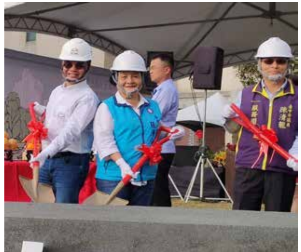
張議員參加公宅破土典禮

張議員正向積極、個性不拘小節，仗義直言的她練就一手好字，書法行草遒勁有力，字如其人，雖然已逾 80 歲高齡，卻還是精力旺盛，認真過好每一天，戮力為市民打拚。