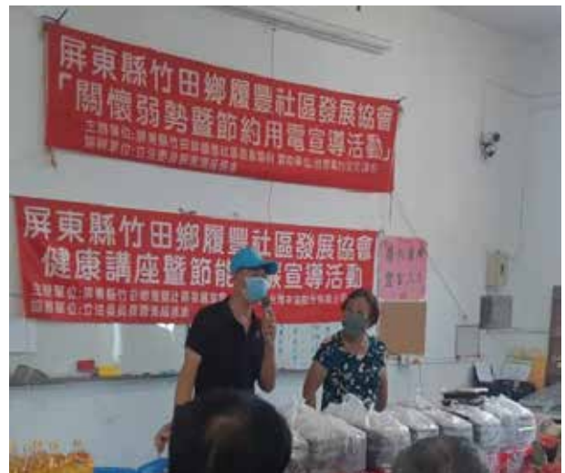
邱村長出席節約用電宣導活動

邱村長總是掛念村內大小事，遇事必躬親竭盡所能，秉持一人當選全家服務信念，全家共同為村民服務，並抱著一日村長，終身村長的精神，將履豐村建設得更舒適、更美好，成為大家心目中理想的村莊。