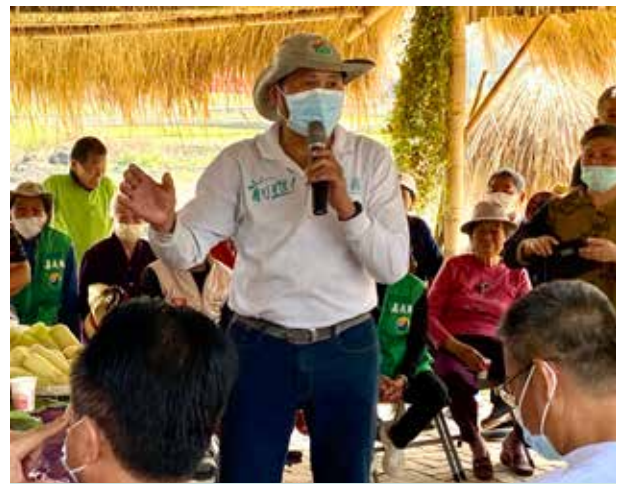
陳村長主持社區活動