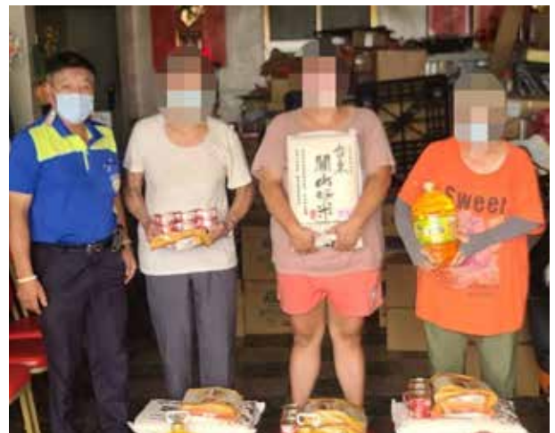
李里長結合在地資源給予里民生活物資

團結力量大，李里長結合志工，以用心、愛心、積極心為里民服務，建立「大家關懷，發揮愛心」的和諧社區。