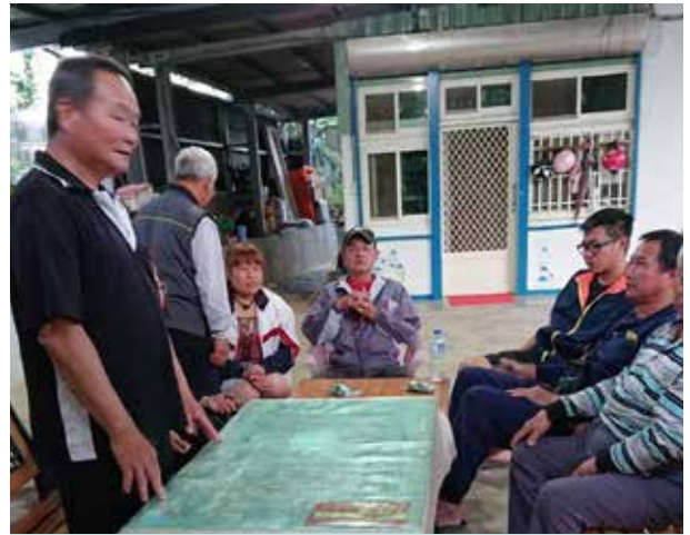
陳里長召開社區防災討論會議

陳里長對於行的安全非常重視，增設路邊防撞桿，防止汽機車掉落邊溝，使里內路平、燈亮、水溝通，讓民眾有所感受到里內環境改善。