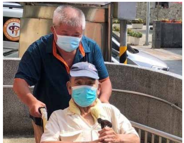
李里長協助中風里民就醫

關懷里內獨居長者及行動不便之弱勢族群為李里長每天的例行活動，里內另有位獨老里民長年住在交通不便的山區，因採買不方便常需自行煮飯，卻因年紀大常煮到忘記關火，實有醞釀火災之疑慮，里長知情後因擔心里民的居家安全，便決定每天親送便當，讓該里民免去忘記關火而釀災的風險。