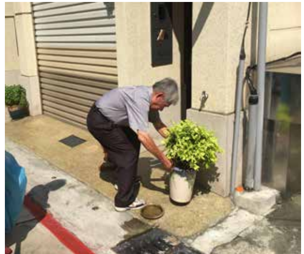
歐里長巡檢社區登革熱孳生源

歐里長風雨無阻的身影，深植里民心中，相當受里民愛戴，是位盡心盡力為民服務的里長。