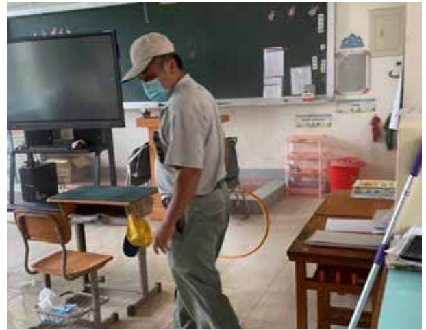
洪村長至學校協助環境消毒

洪村長也很注重村內環境衛生，努力配合防疫業務，不論是將口罩發放給獨居長者或是校園環境消毒，均親力親為，認真執行環境清潔工作，減少村內疫情發生，維護村民身心健康。