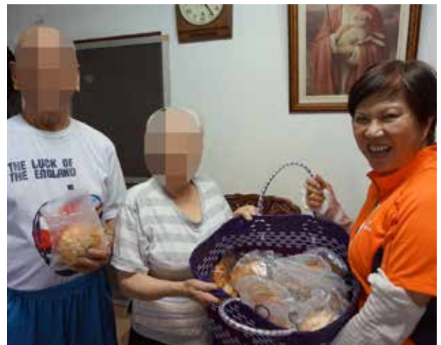
仇里長親送麵包至弱勢家庭

此外，仇里長將里內廢棄陸軍營區，整理為天山公園，讓環境煥然一新，晚上人潮不斷，使得原本為治安死角的營區搖身一變為里內著名景點，親子家庭同樂。