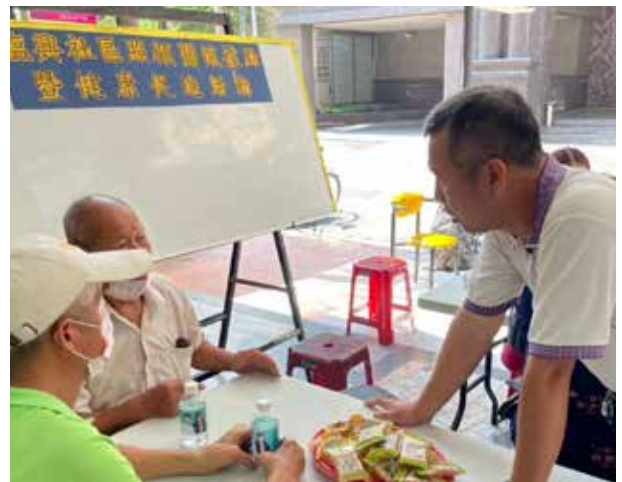
鄭里長（右）瞭解里民疑難雜症

鄭里長剛毅性格中保有柔軟的心，熱心服務里民，爭取各項建設，服務成效有目共睹，著實溫暖了里民。