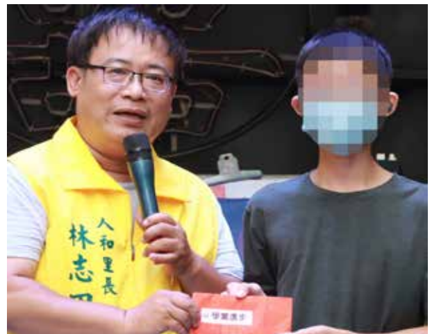
林里長致贈弱勢里民獎學金

近年來為了鼓勵長輩走出家門並得到更全面的照護，林里長成立了社區照顧關懷據點辦理如共餐、手作、運動等課程活動，里長都全程參與，看到長輩更為開朗健康，讓年輕人在工作時不用擔心家中長輩，林里長也相當欣慰。