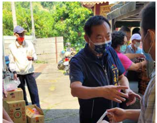
黃里長於重陽節發送麵線

除了讓里民能有安心的居住環境，黃里長也戮力增進里內生活環境品質。時常於里內穿梭來回服務的黃里長，不時發現垃圾被隨意棄置在路旁，讓黃里長意識到里內的環境衛生需要共同維護，因此召集了志同道合的里民，成立了環保志工隊，積極進行里內環境清掃，消除髒亂。每次清潔活動之後，里民們也紛紛對黃里長和環保志工表示感謝和支持，讓他們更有動力繼續從事環保志工的工作。