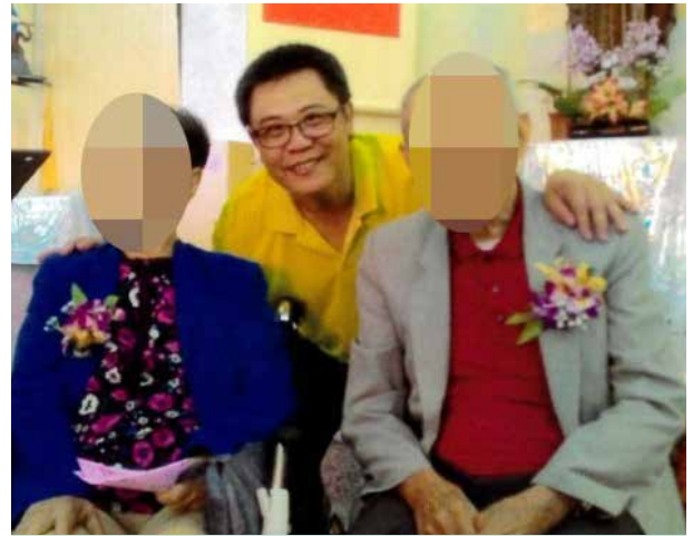
林里長深獲長者信任

連原本里內從不與人交談的獨居長者，亦被林里長熱情爽朗的言談所感動，願意與林里長溝通交流，甚且連原本不願接觸家人的鰥寡長輩，都能逐漸敞開心門，向外邁出互動的步伐。除此之外，林里長對於里民的細瑣民生事務皆積極提供援助，從生活意外救護到涉訟協助，堅持熱誠服務的初衷，用心照護服務里民的生活大小事，不負里民的託付，更塑造共和里成為東港鎮的溫馨家園。