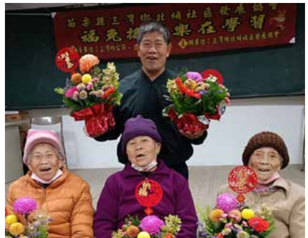
黃村長與村民參加社區發展協會插花班活動

黃村長本著服務熱忱，日夜為村務竭盡心力，他最感謝的是村民給他服務的機會，以及妻子全力支持，讓他無後顧之憂，用心打造幸福與舒適的北埔村。