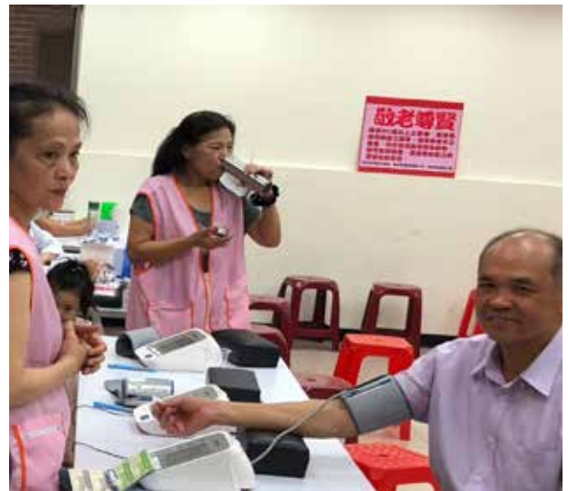
施里長洽請醫院免費為里民健康篩檢

謙卑、誠懇、總是面帶微笑的施里長，處處為里民著想、時時為里民服務，施里長總說：「多一點慈悲與多一點智慧，這個社會就會愈來愈好。」41 年的青春與熱忱，全心全意為後港里付出，為里民打造幸福家園。