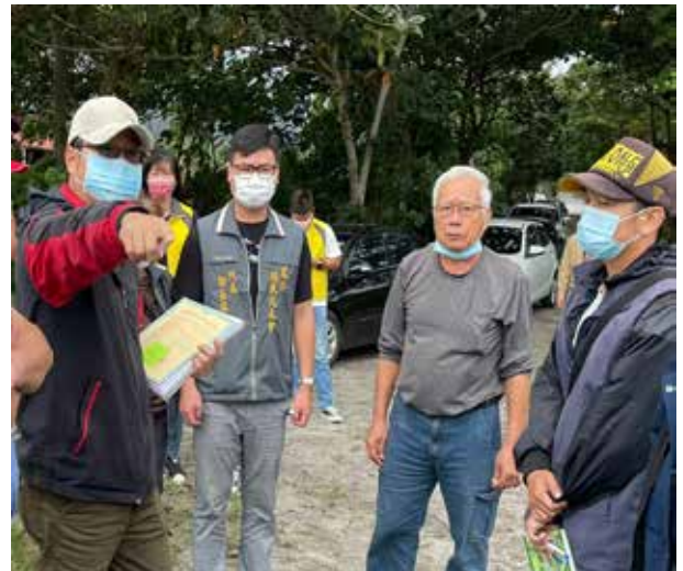
馮代表 (右 2) 出席農路改善工程勘察

馮代表也積極推廣民俗技藝活動，發揚傳統文化，並爭取改善國中小學校的教學設備及校園設施，也時常關懷鎮內弱勢族群，協助申請社會福利，深獲鎮民信賴。