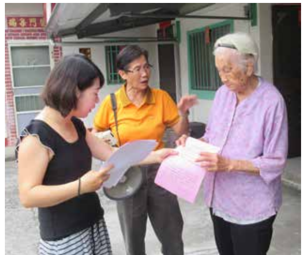
陳里長參加救災防災宣導活動

為免去里內獨居老人因地處偏遠來往醫院的勞累，陳里長也會幫忙接送至醫院看病；在嚴重特殊傳染性肺炎防疫期間，陳里長也不辭辛勞協助公所接送長輩公費疫苗施打，為防疫共盡一份心力，其服務精神值得表揚。