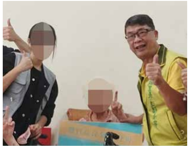
施里長與志工協助獨居長輩住家清掃

過年前家家戶戶除舊佈新，惟有部分獨居長輩行動不便，也無子女協助，施里長特別與里內餐廳及志工進行歲末大掃除活動，協助獨居長輩整理環境、清除垃圾、張貼春聯及換燈泡插座等家務，讓他們也能享受新年新氣象。同時施里長加碼以選舉補助金及資源回收基金等，提撥作為邊緣戶年節加菜金，由群組內里民公開推薦，希望藉由左鄰右舍互動關懷，讓邊緣戶於歲末寒冬時刻，體會鄰居友善的關懷。