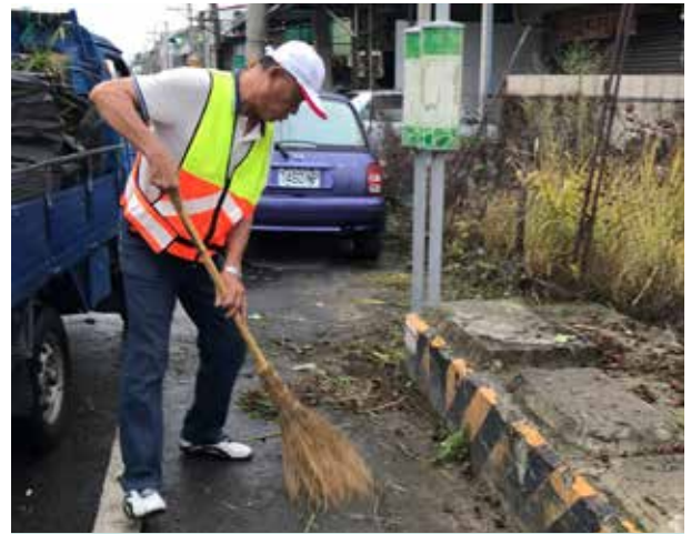
李里長維護里內環境清潔

隨著南部科學園區帶來的人口外溢效應，新化區本身因具地利之便，太平里也新增許多建案，里內人口激增。李里長有感里民休閒運動空間不足，也無可以聚會的活動中心，便向公所積極爭取經費在里內興建聯合活動中心，聯合活動中心內規劃綜合球場、多功能教室與小型會議室，提供里民及附近居民平時運動休閒、辦理講座及聚會等，他還組織志工協助公所管理及維護聯合活動中心的軟硬體設備，並透過公私協力的方式，活化里內公共空間，提升里民的幸福感。