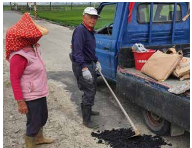
林村長鋪設瀝青混凝土