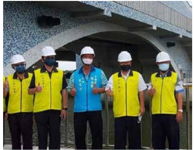
王里長(中)與公所人員巡視抽水站及水門

王里長十分關心里內各項建設，龍山里為易淹水地區，尤其颱風來襲時，海水常倒灌入里內，因此王里長總會在颱風登陸前親自堆置沙包，以防堵倒灌或減緩倒灌的嚴重程度。另外，王里長為防患未然，亦持續爭取相關建設，已順利爭取於里內增設抽水機 1 台以因應汛期；另里內的「六成中排護岸」及路面曾損壞不勘使用，為維護人民生命財產安全，經里長積極提報，目前護岸改善工程已持續進行中；為維護里內舌閘及水門正常運作，亦已爭取相關經費，並由區公所著手辦理中。