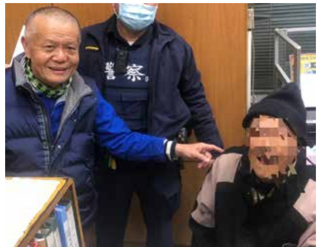
余里長指認走失長者

另里內曾有古厝因居民年歲漸長管理乏力，加以老樹植栽遍布，昏暗髒亂。為改善此情形，里長帶領守望相助隊發動6工作梯次(1次20人)修剪漫天蔽日的老樹枝幹，清除遍地植被雜草後，不僅病媒蚊等孳生源無處可藏，透過環境綠美化和社區營造力量重現風華，成為自行車導覽觀光景點。