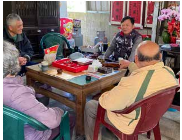
鄭村長與村民討論獨居老人關懷事宜

鄭村長帶領村民不定期清潔打掃村內環境，曾獲得 111 年度嘉義縣環境清潔競賽「村里組一山區」第 4 名的成績；鄭村長亦照顧村裡農業人口，積極宣導有關農業福利政策，鼓勵村民參加農業訓練課程，讓村民精進農作物栽種的專業知能，進而審慎規劃未來農產種植品項及產量，提升農業收入。