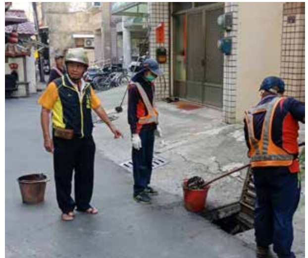
王里長參與水溝清淤

王里長鑑於里內老年人口日益增加，體恤年長者經濟需要，每年重陽節王里長自掏腰包加碼禮金給里內300餘位65歲以上長者，十數年來不曾間斷。王里長說，看到長者們心滿意足，自己也很開心，不會去計較付出多少金錢。王里長無私奉獻，深受里民愛戴。