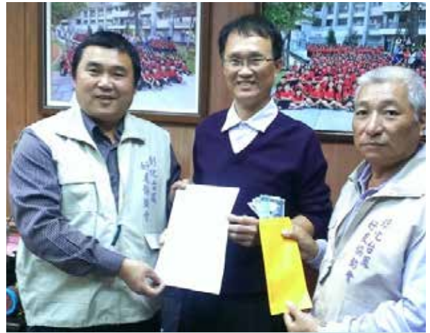
劉里長致贈學校急難救助慰問金

劉里長積極爭取整修舊排水溝、重鋪路面瀝青以及邊坡整治等多項工程施作，尤其是里內的聯外道路，原本雜草叢生、路面凹凸不平及狹窄不利通行，在劉里長積極爭取下，設置避車彎，並且適當維護周圍環境，如今可便利里民安全往返，進而提升全里生活品質。