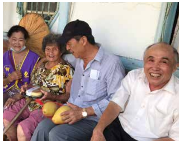
蘇里長於關懷據點關懷里內長者

蘇里長也積極爭取里內建設，例如爭取改善排水工程，以防止里內野溪阻塞；拓寬農路並增設擋土牆以解決農路交通及安全問題，以及爭取建設里內自行車道，讓民眾能安心地散步騎車等，使東正里成為人間天堂，處處充滿溫馨快樂的氛圍。