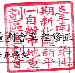
附件1、臺南市第142期新化區新平(一)自辦市地重劃區重劃會章程修正對照表