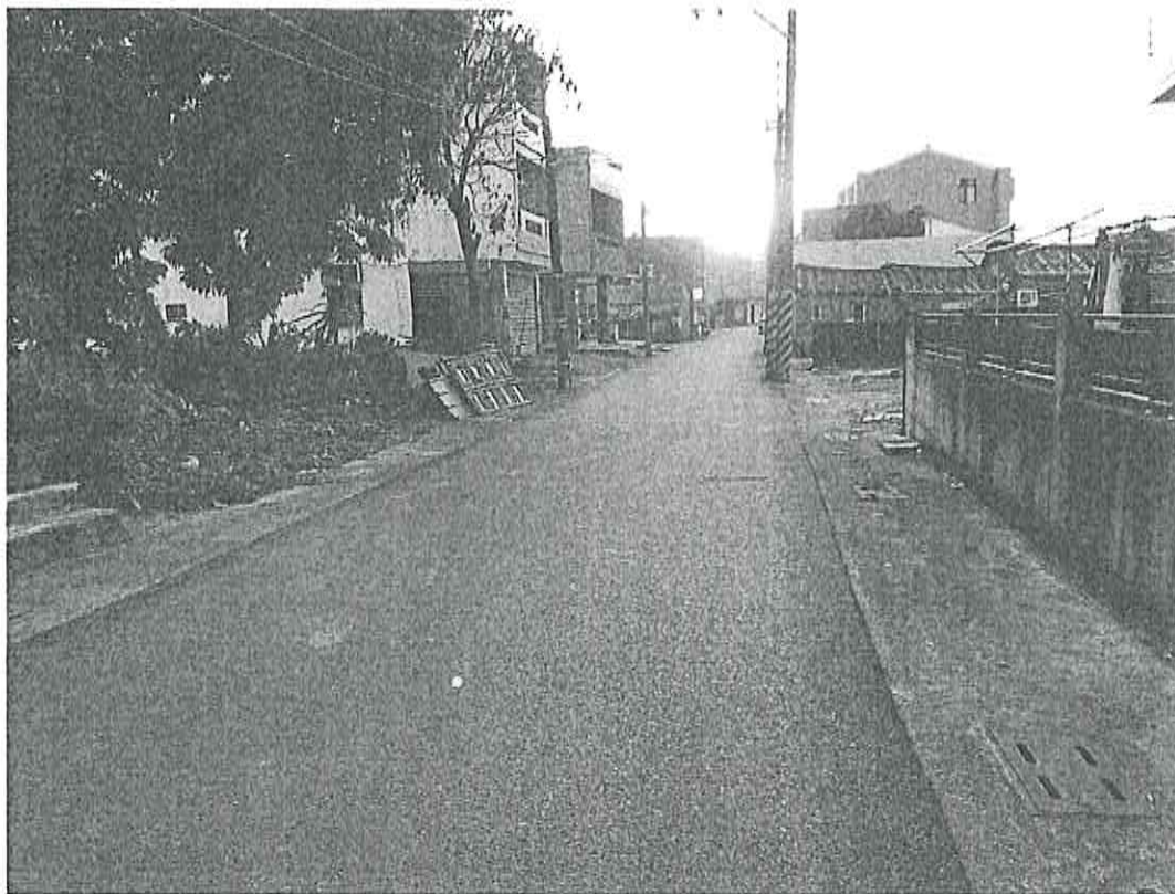
鹽水舊營段後寮小段 160-1 等道路照片