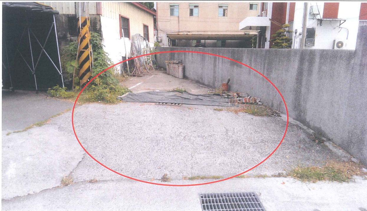
歸仁區媽祖廟段 468-14 及 468-18 等 2 筆地號現況照片