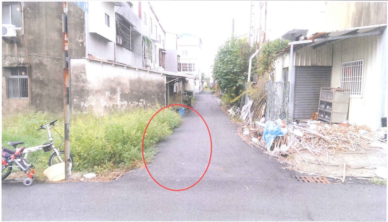
歸仁區八甲西段 635 地號現況照片