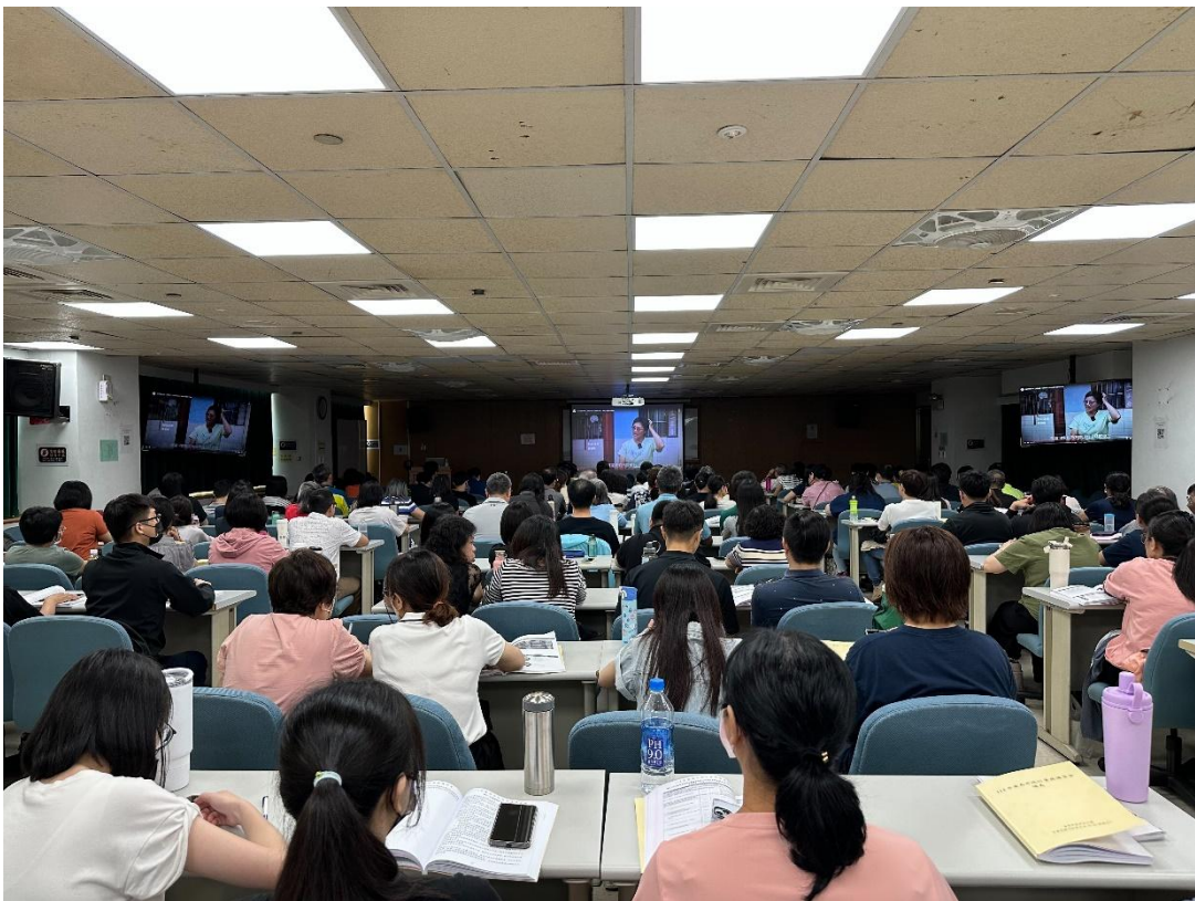
照片說明：播放 CEDAW 佳里區公所宣導短片