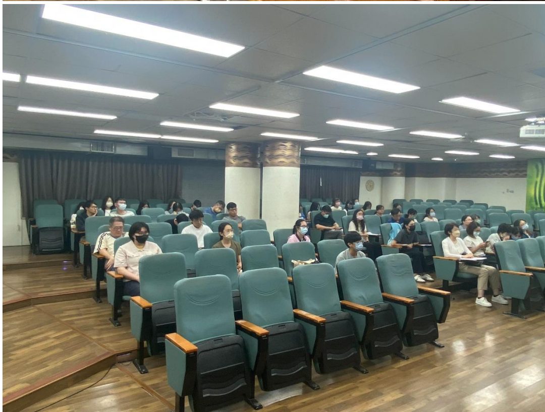
照片說明：宣導 CEDAW 自製宣導媒材，解說本市勞動市場性別狀況。