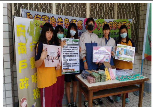
新興國中發證宣導(4/18)