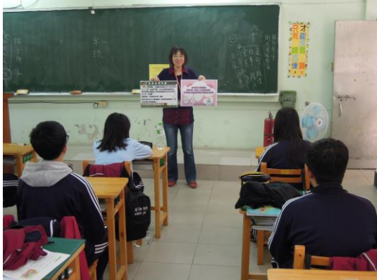
南寧高中(國中部)發證宣導(2/27)