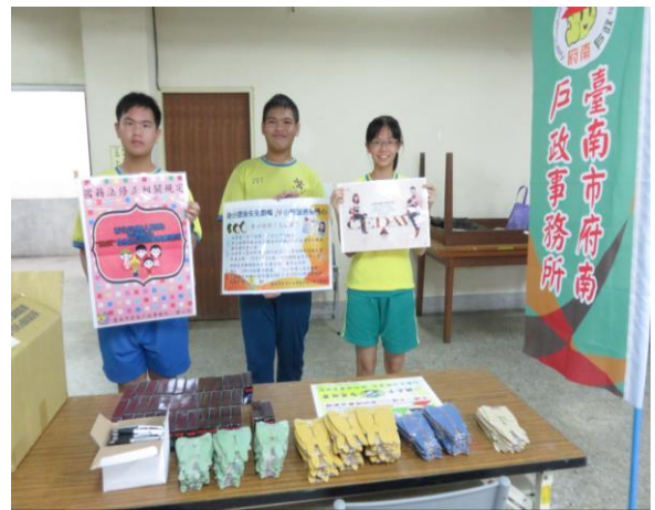
新興國中發證宣導(4/27)