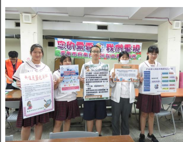
新興國中發證宣導(4/27)