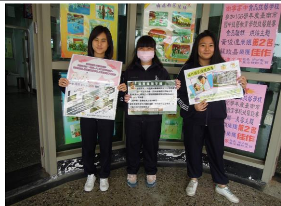
南寧高中(國中部)發證宣導(2/27)