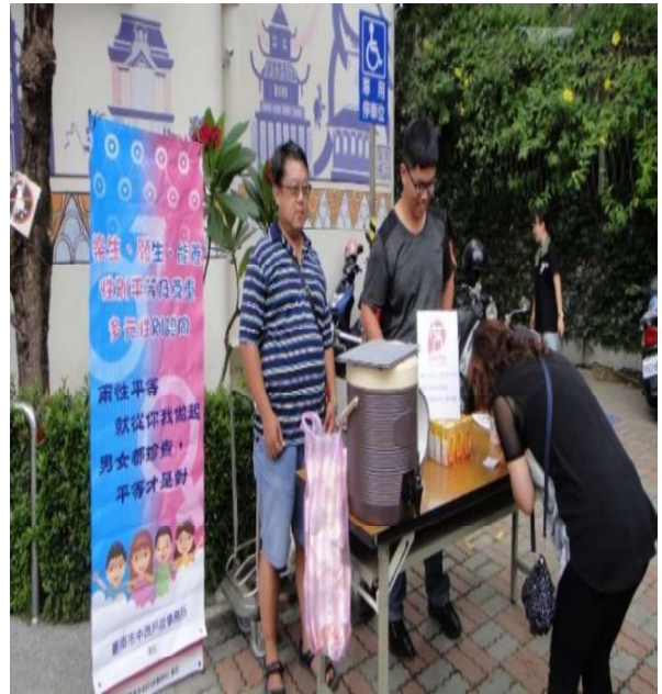
在臺南市中西戶政事務所大門口與停車場設攤-性別平等立牌宣導