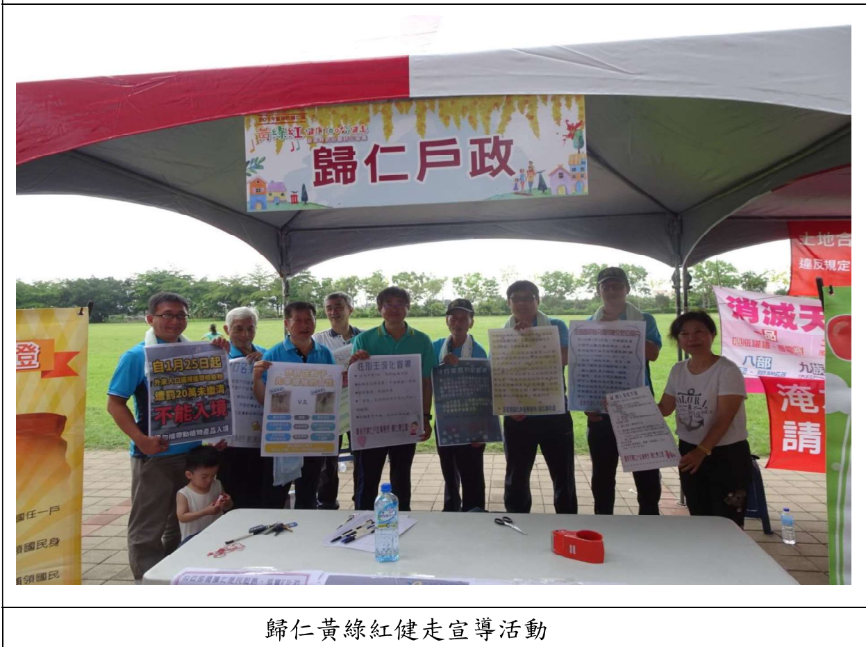
歸仁黃綠紅健走宣導活動