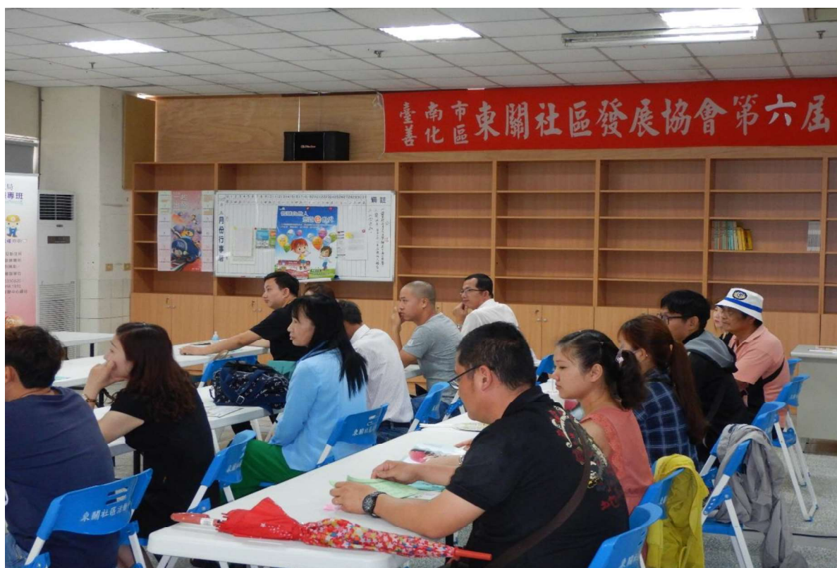
108年6月新住民家庭教育法令宣導