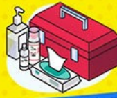
修繕工具、清潔及消毒用品