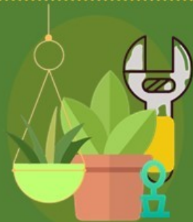
固定植栽及懸掛物