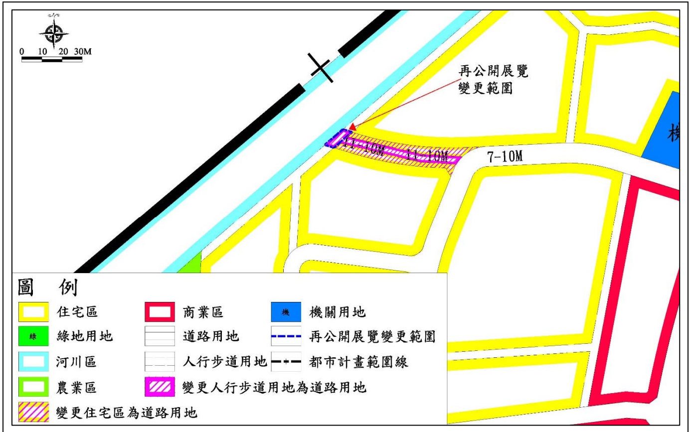
圖2 變更內容示意圖(1)